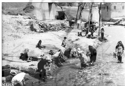
شکل ۱۳- چشمه های شهر همدان

در گذشته با گسترش شهر همدان مردم از تجربه خود و دیگران بهره برده و علاوه بر رودخانه ها از آب های خودجوش بهره گرفته و مسیر آن ها را سنگ چین کرده و راهشان را هموار و به دلخواه تغییر داده اند به طوری که سنگی بودن لایه درونی سطح همدان، خود نیز به این کوشش توان بخشیده است. در همین مسیر مردم همدان نیز با ایجاد گذار و مجرا، آب پراکنده را در مسیر دلخواه هدایت کرده و از مزایای این روزی بزرگ بهره مندمی شدند (خبرگزاری مهر، ۱۳۹۰). چشمه چمن کلپا نیز یکی از این چشمه های معروف محلات شهر همدان است که این روزها تنها نامی از آن ها باقی مانده است. طرح احیاء این چشمه ها در راستای ایجاد شرایطی مناسب از لحاظ زیستی و علاوه بر شاخص نمودن محله کلپا بیش از گذشته منجر به جذب گردشگر و آورده اقتصادی برای محله کلپا و شهر همدان شکل می گردد.