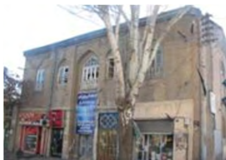
شکل ۶- خانه صالحان