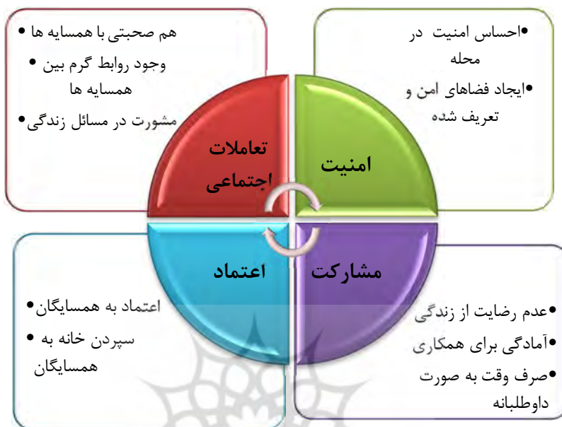
نمودار ۲- مدل پیشنهادی محرک توسعه محله کلیپا

در زمینه مسائل اجتماعی فرهنگی مد نظر ساکنان محله، دل مشغولی های آنان را نیز در رابطه با تک تک عوامل پیشنهاد می دهد.