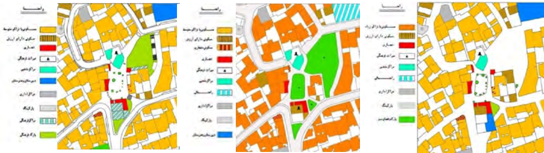
شکل ۵- نقشه طرح پیشنهادی

همدان است، از بین رفتن بافت کهن و برهم زدن همپیوندی و یکپارچگی مرکز محله به عنوان طرح پیشنهادی مطرح گردید. همچنین ممانعت از ورود وسایل نقلیه به مرکز محله و توجه به پیاده مداری از طرح های پیشنهادی به منظور ارتقاء همپیوندی و به منظور تقویت بافت ارگانیک و اندام واره ای محله اتخاذ گردید.