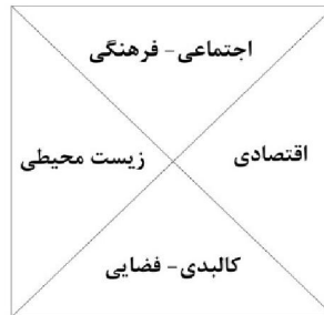
شکل ۱- مدل بازآفرینی شهری

های فرهنگی و هنری، راه اندازی فستیوال ادبی- سینمایی، مدیریت رویدادهای ورزشی، هدایت صنعت جهانگردی و توجه به برنامه های گذران اوقات فراغت به عنوان محور اصلی برنامه های بازآفرینی شهری شناخته شدند (ایزدی، ۱۳۹۰).