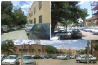
شکل ۱۰- پارک خودرو در محله

محدوده مورد بررسی در این پژوهش، در بخش مرکزی شهر همدان واقع شده که از شمال به خیابان پانزده فروردین، از جنوب به خیابان بوعلی، از غرب به بلوار آیت ا... مدنی و از شرق به خیابان طالقانی محصور شده است. در محدوده مورد مطالعه همه راه‌ها از پوشش آسفالت برخوردارند که البته میزان کیفیت آنها متفاوت است و به علت تکرار و ترمیم آسفالت‌ریزی به صورتی نامناسب در آمده‌اند. در کنار پوشش سطوح، عدم تخصیص فضایی برای عابر پیاده و سطح پایین ایمنی و امنیت در نتیجه حضور همه جانبه خودروها در معابر از دیگر مشکلاتی است که درخور توجه می‌باشند. در این راستا مهمترین اقدام جهت کاهش عبور و مرور خودروهای شخصی غریبه از سطح معابر محو نمودن و در بعضی موارد قطع نمودن ارتباط مشخص بین ورودی های محله می‌باشد. آن چه در این طرح در کنار دیگر اقدامات از اهمیت ویژه‌ای برخوردار است خارج نمودن مرکز محله کلیا از مسیر عبور مرور خودروهای غریبه می‌باشد.