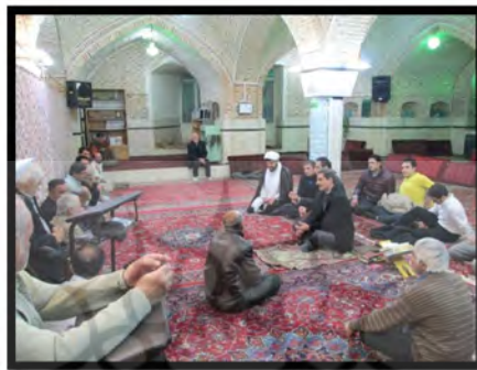
شکل ۱۱- نشست مردم مسئولین و گروه طراحی

طرح های موفق در حیطه طراحی شهری اغلب مشارکت بالای مردم را در خود سهیم می بینند. اهتمام ورزیدن به خواست جمعی ساکنان محله، برآورد و نیاز سنجی از مردم، مشورت و هم افزایی نظرات و پیشنهادهای ساکنین محله در تمام قسمت های طرح اعم از شناخت ابتدایی پروژه، در طول فرایند طراحی و تا نتایج انتهایی پروژه در دستور اصلی طراحی قرار گرفت. مشاهده تلاش گروه طراحی و توجه به نکات گفته شده، ساکنین را ترغیب به مشارکت و کمک در روند تهیه طرح و اقدامات موثر در این عرصه گردانید.