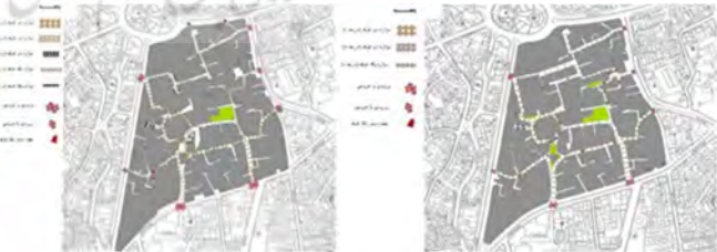
شکل ۹- نقشه ترافیکی وضع موجود، نقشه ترافیکی پیشنهادی