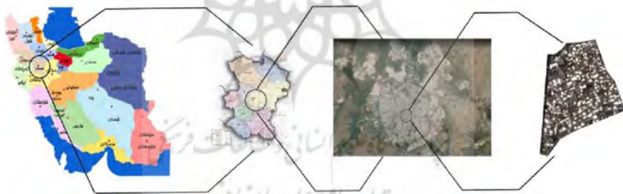
شکل ۳- محل قرارگیری محله کلیا در سطح شهر همدان

و مرکزیت را تقویت کند (لطیفی و صابری چابک، ۱۳۹۲). وجود و تداوم محور اصلی محله همراه با گذرهای پیاده، شبکه‌ای از مراکز فرعی محله و وحدت شکلی آن را باید چارچوب و استخوان بندی اصلی محله دانست. ترکیب عملکردها و فعالیت‌ها برای ایجاد وحدت فضایی، وجود نشانه‌ها و عرصه‌های مختلف نیمه خصوصی، نیمه عمومی و عمومی به عنوان بستر اصلی در تعاملات و روابط اجتماعی نیز از ویژگی‌های محله محسوب می‌شوند (حبیبی، ۱۳۸۲). محله کلیا در مرکز همدان و در قسمت جنوب شرقی میدان آرامگاه واقع شده است. محله کلیا دارای قدمتی طولانی و بافتی است که در دوران گذشته دستخوش تغییرات زیادی گشته است. حوزه نفوذ این محله به وسیله خیابان‌هایی که آن را دربرگرفته مشخص شده است. این محله دارای خصوصیات خاصی است که آن را در شهر همدان متمایز ساخته است. جداره‌های تجاری و همچنین بافت مسکونی جدید در کنار بافت‌های قدیمی در محله در کنار یکدیگر نشسته‌اند. رشد کالبدی همدان در دهه‌های قبل به سمت جنوب شهر بوده که منجر به تغییر مرکز ثقل کالبدی و جمعیتی همدان با گذشت زمان از سمت میدان امام به صورت تدریجی به سمت جنوب و به طرف میدان آرامگاه شده است. این امر شرایط بروز تحولات زیادی در ۲ دهه اخیر در محله کلیا را منجر شده و چهره و منظر محله قدیمی را نیز دگرگون کرده است.