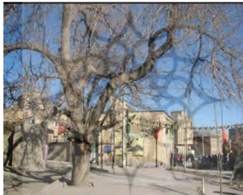
شکل ۱۲- درختان کهنسال مرکز محله

چمن محله یکی از مهمترین عناصر ساختار کلی محلات شهر همدان را تشکیل می دهد، به نوعی که مرکز محلات قدیمی همدان را تنها با چمن آن محله می شناسند و در بین مردم شهر همدان رواج دارد. حفظ و تقویت چمن محله به عنوان یکی از ارکان اصلی محلات سنتی از مهمترین اهداف پژوهش صورت گرفته گروه طراحی بوده است. به منظور این هدف جلوگیری از آسیب رساندن و تاکید برحفظ و نگهداری از درختان کهنسال در مرکز محله از طرح های پیشنهادی در بخش محیط زیست به حساب می رود.