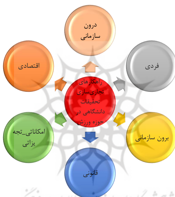
شکل ۱. مدل نهایی راهکارهای تجاری‌سازی تحقیقات دانشگاهی در حوزه ورزش

پس از تحلیل داده‌های به دست آمده از مصاحبه‌ها راهکارهای تجاری‌سازی تحقیقات در حوزه ورزش استخراج شد. در بخش مفاهیم ۵۷ کد به دست آمد که از کدگذاری این بخش ۱۰ مقوله شامل آموزشی-پژوهشی، منابع انسانی، مدیریتی، بازاریابی، شخصیتی، ارتباطی، سیاست‌گذاری، حقوقی-نظارتی، سخت‌افزاری- نرم‌افزاری، اقتصادی به دست آمد. در ادامه از کدگذاری مقوله‌ها، ابعاد به دست آمد که شامل ۶ بعد درون‌سازمانی، فردی، برون‌سازمانی، قانونی، امکانات-تجهیزاتی، اقتصادی بود که در نهایت به مدل نهایی ختم شد که در شکل ۱ ملاحظه می‌شود.