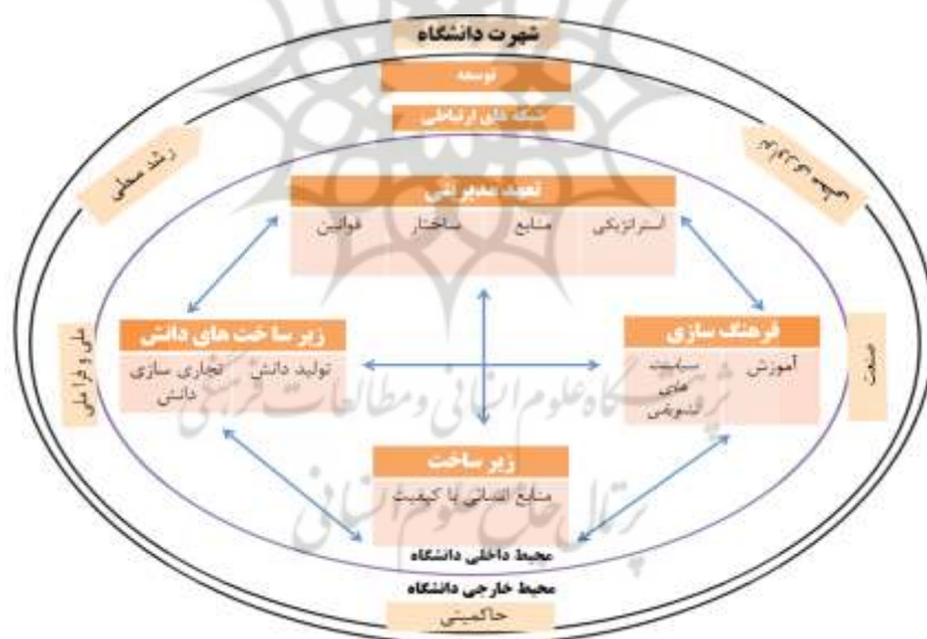
نمودار ۳: مدل تجاری سازی دانش بر اساس اکوسیستم کارآفرینی

متأسفانه با وجود انباشت تحقیقات در خصوص تجاری سازی دانش در دانشگاه‌ها، مدل‌های موجود، رویکردی جامع‌نگر در این حوزه نداشته‌اند و خلاء پژوهشی در خصوص احصاء ابعاد معرفی شده و بیان آنها در قالب یک مدل یکپارچه احساس می‌گردد. لذا این پژوهش، بر اساس روش متاستز، یک طبقه‌بندی عمومی از مشخصات تجاری سازی دانش بر اساس اکوسیستم کارآفرینی را احصاء کرده و هفت زمینه اصلی تجاری سازی دانش دانشگاه بر اساس اکوسیستم کارآفرینی را معرفی می‌نماید. پایه و اساس زمینه‌های استخراج شده ۸۳ ویژگی است که از طریق متاستز ۶۰ مطالعه معتبر در حوزه تجاری سازی دانش شناسایی گردید. این ویژگی‌ها در ۱۸ مقوله که ویژگی‌های تجاری سازی دانش در دانشگاه را بر اساس اکوسیستم کارآفرینی تعریف می‌کنند، کدبندی و طبقه‌بندی شدند، از ۱۸ عنصر ۱۳ عنصر در ۵ زمینه اصلی محیط داخلی شامل: تعهد مدیریتی، فرهنگ کارآفرینی، زیرساخت‌های تولید دانش و تجاری سازی دانش، زیرساخت کیفیت منابع انسانی و ۵ عنصر در ۲ زمینه اصلی تعاملات و توسعه محیط خارجی طبقه‌بندی شدند که در نمودار ۳ نشان داده شده است.