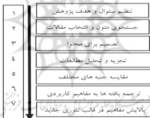
نمودار ۱: فرایند فرا ترکیب

فرا ترکیب ۱ رویکردی نظام مند برای ترکیب پژوهش های کیفی مختلف در راستای کشف زمینه های فرعی و اصلی، جدید و اساسی است که موجب ارتقاء دانش جدید شده و دید جامع تری را از حوزه مورد بررسی به وجود می آورد. پژوهشگران در روش فرا ترکیب نیازمند بررسی دقیق و عمیق مطالعات کیفی پیشین هستند و از این طریق، نمایش جامع تری از پدیده تحت بررسی را نشان می دهند. استفاده از فرا ترکیب نتیجه ای را به دست می دهد که بزرگ تر از مجموع بخش هایش است (سهرابی و همکاران، ۱۳۹۰). والش و دون با مروری بر مطالعات فرا ترکیب، روش هفت مرحله ای، شامل تنظیم سؤال پژوهش، انتخاب مقالات، تصمیم برای محتوا، تجزیه و تحلیل مطالعات، مقایسه جنبه های مختلف، ترجمه یافته ها به مفاهیم قابل درک و کاربردی و پالایش مفاهیم در قالب تئوری جدید را معرفی کردند (والش و دون ۲ ، ۲۰۰۵). و در تحقیق حاضر از این فرایند استفاده شده است. نمودار (۱) مراحل فرا ترکیب را نشان داده و در ادامه، جزئیات این فرایند به طور کامل شرح داده شده است.