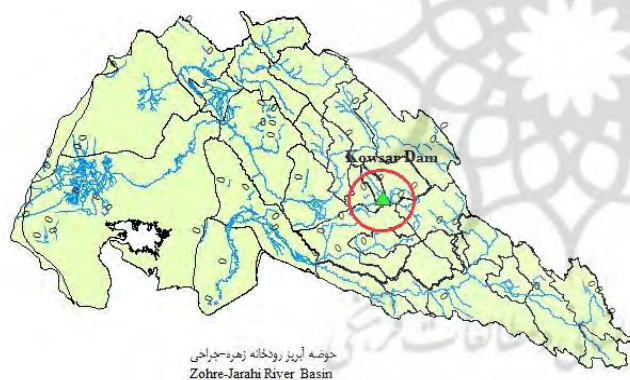
شکل ۱. موقعیت سد مخزنی کوثر در حوضه آبریز رودخانه زهره و جراحی

سد کوثر بر روی رودخانه خیرآباد و در فاصله ۴۲ کیلومتری شمال غرب شهر گچساران واقع شده است. این سد به ارتفاع ۱۴۴ متر از نوع بتنی وزنی و حجم مخزن ۵۸۰ میلیون مترمکعب سالیانه ۴۲۶ میلیون مترمکعب آب را برای مصارف آب شهری، کشاورزی و زیست‌محیطی تنظیم می‌کند. یکی از اهداف مهم سد تأمین آب شهری و صنعتی به میزان ۱۸۲ میلیون مترمکعب در سال و تأمین آب طرح بزرگ آبرسانی به شهرهای حاشیه خلیج فارس است. هدف از اجرای طرح آبرسانی شهر گچساران تأمین آب این شهر و روستاهای بین راه در افق سال ۱۴۱۰ برای جمعیتی معادل ۱۵۵۰۰۰ نفر است. شبکه آبیاری زهکشی دشت لیشر نیز از اهداف سد مخزنی کوثر است که در استان کهگیلویه و بویراحمد در فاصله ۲۰ کیلومتری غرب شهرستان گچساران واقع است (شکل ۱).