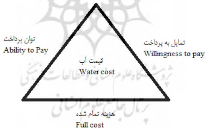
شکل ۲. ارکان قیمت‌گذاری آب

هزینه فرصت از دست رفته تأمین آب معادل با سود ناشی از سپرده‌گذاری هزینه‌های تأمین آب برای مصارف مختلف با نرخ سود تنزیل ۲۰ درصد است. بدین طریق که درصدی از هزینه‌های بهره‌برداری، نگهداری و سرمایه‌ای در هر مرحله به‌عنوان هزینه فرصت در هر سال مد نظر قرار می‌گیرد. این درصد بیانگر نرخ سود بلند مدت سپرده‌گذاری بانکی هر سال (نرخ سود سپرده‌گذاری بلندمدت برگرفته از سایت بانک مرکزی جمهوری اسلامی ایران) می‌باشد. سپس مجموع ارزش فعلی هزینه‌های فرصت حاصله هر سال را با نرخ ۲۰ درصد محاسبه و مقدار آب در دسترس تقسیم نموده و بدین صورت هزینه فرصت تأمین هر مترمکعب آب در هر مرحله شامل آب پای سد کوثر، آب تصفیه‌خانه، انتقال آب و شبکه آبرسانی دشت لیشر محاسبه می‌گردد. در پایان از مجموع هزینه‌های فرصت هر مترمکعب تأمین آب پای سد کوثر و شبکه آبیاری دشت لیشر، هزینه فرصت تأمین یک مترمکعب آب کشاورزی و از مجموع هزینه‌های فرصت هر مترمکعب آب پای سد کوثر، بعد از تصفیه و