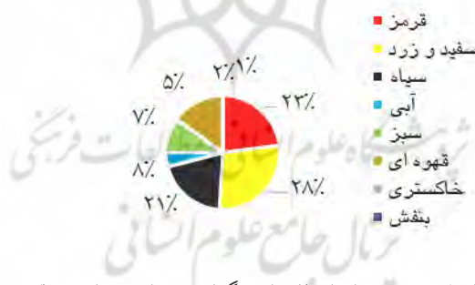
نمودار شماره ۳: درصد میزان استفاده از رنگها در دیوان میرزاده عشقی