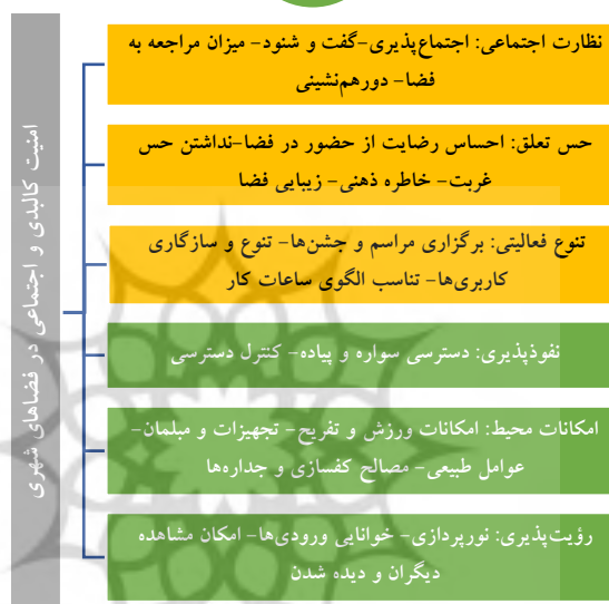
شکل ۲- متغیرهای مؤثر بر امنیت کالبدی و اجتماعی در فضاهای شهری