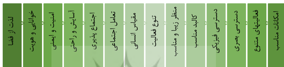
شکل ۱- ویژگی‌های فضاهای شهری جذاب و ایمن

قرار نگرفته است. به همین منظور، در یک مطالعه مقدماتی، این پرسشنامه در اختیار ۳۰ نفر از کارشناسان حوزه معماری و شهرسازی در شهر قزوین قرار داده شد تا میزان پایایی پرسشنامه به‌دست آید. سنجش پایایی پرسش‌ها با آزمون آلفای کرونباخ انجام گرفت که سطح قابل قبولی از پایایی (۰/۸۱) را نشان داد. جهت اولویت‌سنجی عناصر کالبدی و اجتماعی امنیت در فضاهای شهری ویژه بانوان از سه شاخص کالبدی (نفوذپذیری بصری/ فیزیکی، رؤیت‌پذیری روزانه/ شبانه و امکانات محیط) و سه شاخص اجتماعی