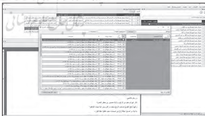
تصویر شماره ۲: هماهنگ‌سازی کلیدواژه‌ها

۴. نوع رویداد، شامل یکی از دسته‌های: «ولادت، وفات (قتل، شهادت)، اجتماعی، سیاسی، نظامی، دینی، طبیعی، قضایی، اقتصادی، فرهنگی، تمدنی، معجزات» می‌شود.