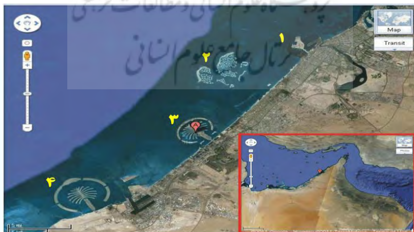
شکل ۴: جزایر مصنوعی امارات متحده عربی

فعالیت های انسانی علاوه بر آلودگی باعث تغییر شکل در ظاهر سواحل نیز گردیده است. یکی از پدیده های مخربی که در سال های نزدیک در کشورهای عرب خلیج فارس آغاز شده، احداث جزایر مصنوعی مسکونی و تفریحی و همچنین پر کردن دریا و اضافه کردن سرزمین است که در امارات متحده عربی، قطر، کویت و بحرین به صورت گسترده ای مشاهده می شود (احمدی، ۱۳۸۸: ۵۳-۵۵). ساخت این جزایر که در آغاز قرن ۲۱ برای اولین بار توسط دولت امارات متحده عربی تحت عنوان پروژه نخل با شعار مکانی بی نقص برای دور شدن از دنیا قطعاً سود کلانی را برای بانیان آن در برداشت، تخریب زیست محیطی گسترده ای را باعث گردید. امارات متحده برنامه ساخت ۳۰۰ جزیره مصنوعی دیگر در سواحل این کشور را در برنامه خود دارد که وضعیت محیط زیست خلیج فارس را پیچیده تر خواهد کرد. برای ساخت هر جزیره باید فیزیک ساحل و دریا درجایی که جزیره ساخته می شود دگرگون شود ضمن اینکه اکوسیستم های دریایی نیز از بین خواهند رفت (عسگری، ۱۳۸۷). جزایر مصنوعی خلیج فارس، حیات دریایی را مورد خطر قرار داده، به صخره های مرجانی آسیب رسانده، بر تیرگی و آلودگی آب دریا افزوده و حیات وحش را مدفون کرده است (Butler, ۲۰۰۵: ۲).