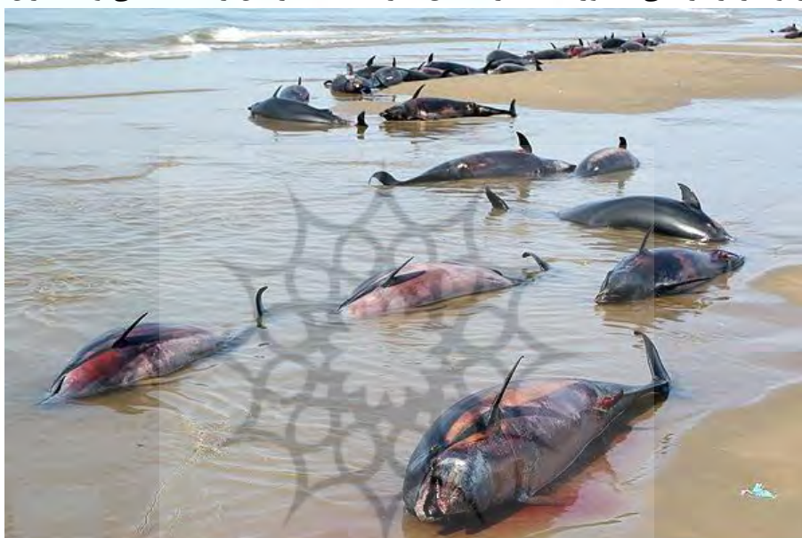
شکل ۳: اثرات آلودگی نفت روی منابع زیستی خلیج فارس

اثراتی که نفت روی محیط‌های زیست دریایی و منابع می‌گذارد، در محلی مانند خلیج فارس به علت وجود شرایط خاص از جمله عمق کم فقدان جریانات آبی و تبادل آب آن با اقیانوس‌ها، تأثیر این منابع (آلوده‌کننده‌ها) بر محیط‌زیست بسیار بیشتر و عوارض و خسارات آن بر محیط شدیدتر است. با جمله به چاه‌های نوروز در خلیج فارس (بهمن‌ماه ۱۳۶۱) که ۱۴ چاه به انضمام ۸ سکوی اکتشافی و تولیدی مورد اصابت هواپیماها و موشک‌های دشمن قرار گرفت و سرازیر شدن حدود ۱۰۰۰ میلیون بشکه نفت به دریا را باعث شد، آلودگی ایجاد شده، جانوران کمیاب و آسیب‌پذیر خلیج فارس مانند گاو و لاک‌پشت دریایی و بعضی از موجودات بارزش دیگر را به تعداد زیاد از بین برد و همچنین گیاهان و جزایر مرجانی به‌طور عمده در مناطق اطراف حادثه از بین رفتند (لطفی و همکاران، ۱۳۸۹: ۷).