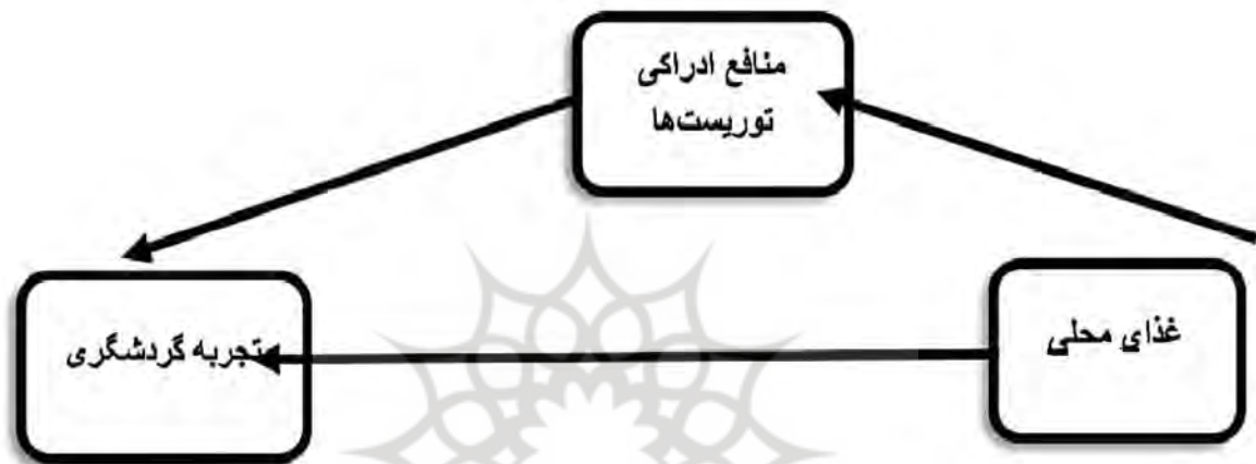
شکل ۱- مدل مفهومی پژوهش

منبع: هان و همکاران (۲۰۲۰) کانوال و همکاران (۲۰۲۰)