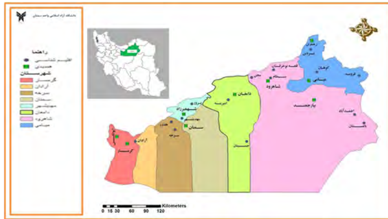
نقشه (۱): موقعیت شهرستان میامی در استان

از نظر موقعیت ارتباطی، شهر میامی در فاصله ۶۰ کیلومتری شهر شاهرود و ۲۳۰ کیلومتری شهر سمنان، ۵۴ کیلومتری شهر بیارجمند؛ ۵۲ کیلومتریشهر کلاته خیج، ۶۳ کیلومتری شهر بسطام نیز قرار دارد. همچنین نزدیکترین و دورترین روستا به شهر، ابراهیم آباد و کلاته ملا به ترتیب ۵ و ۱۵۰ کیلومتر با شهر میامی فاصله دارد.