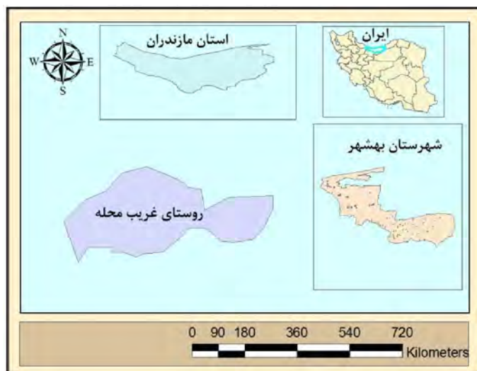
شکل ۳- موقعیت جغرافیایی منطقه مورد مطالعه