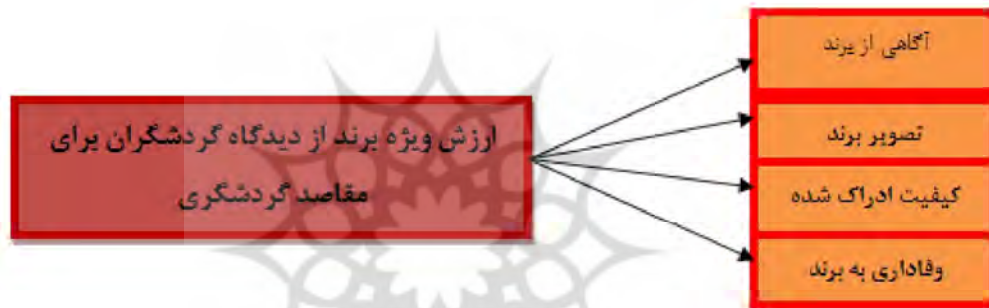
شکل ۱. مدل مفهومی تحقیق

ارتباط آنها) به طور منطقی از طریق مفاهیم مرتبط با یکدیگر بیان می‌شود. بنابراین، مدل منعکس کننده واقعیت است و جنبه‌های معینی از دنیای واقعی را که با مسئله تحت بررسی ارتباط دارند مجسم می‌سازند. روابط عمده را در میان جنبه‌های مذکور روشن می‌کند و سرانجام امکان آزمایش تجربی تئوری را با توجه به ماهیت این روابط فراهم می‌کند. بعد از آزمایش مدل درک بهتری از بعضی از قسمتهای دنیای واقعی حاصل می‌شود. به طور خلاصه باید گفت که مدل دستگامی است متشکل از مفاهیم، فرضیه‌ها و شاخصها که کار انتخاب و جمع‌آوری اطلاعات مورد نیاز برای آزمون فرضیه را تسهیل می‌کند (خاکی، ۱۳۹۰). برای ساختن مدل تحلیلی، محقق نهایتاً می‌تواند به دو شیوه متفاوت عمل کند که میانشان تفاوت مشخصی وجود ندارد: یا ابتدا از تدوین فرضیه‌ها شروع می‌کند و در مرتبه بعدی به مفاهیم می‌پردازد، یا این که راه معکوسی را طی می‌کند (خاکی، ۱۳۹۰). در این تحقیق از مدل کونکنیک و روزیر (۲۰۰۹) که دارای چهار بعد آگاهی از برند، تصویر برند، کیفیت ادراک شده و وفاداری به برند، کیفیت ادراک شده و وفاداری به برند می‌باشد، استفاده شده است.