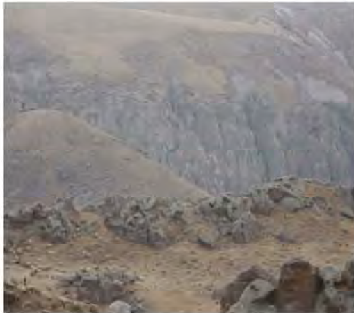
شکل ۲: شیروان دره سی