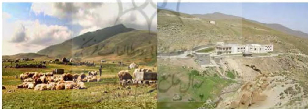
شکل ۱۰: مناظر ییلاقی هوشنگ میدانی