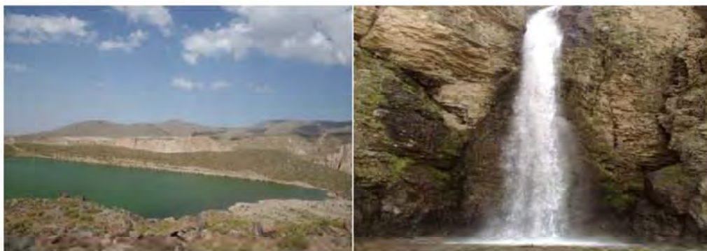
شکل ۶: تالاب آتی گلی

جلوگیری از تعارض گردشگران و مردم منطقه در زمینه فرهنگ و آداب و رسوم ۱۰- جمع آوری به موقع زباله‌ها و مواد زائد و همچنین مطلوب بودن تابلوها و علائم راهنمایی برای ارائه خدمات و رضایت گردشگران.