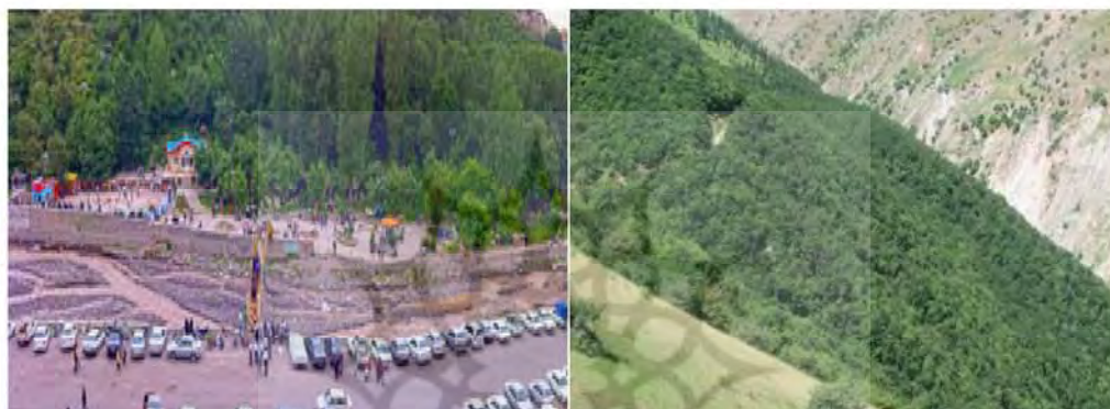
شکل ۸: پارک جنگلی مشگین شهر