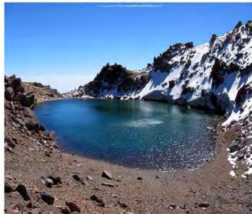
شکل ۱: قله و دریاچه سبلان