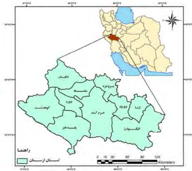
شکل ۱: موقعیت محدوده مورد مطالعه