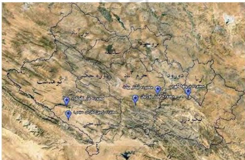
شکل ۲: محدوده های پیشنهادی جهت معرفی به عنوان ژئوپارک جهت معرفی در استان لرستان

در بخش پائینی ساختار سلسله مراتبی، گزینه‌های پیشنهادی جهت تعیین محدوده ژئوپارک قرار دارد. این گزینه‌های با توجه به ویژگی‌های زمین شناختی و جنبه‌های زیباشناختی آن، از میان جاذبه‌های فراوان ژئوتوریستی در استان لرستان انتخاب شده‌اند. محدوده‌های مورد نظر علاوه بر اینکه دارای جنبه‌های ژئومورفولوژیک و زمین شناختی می‌باشند، با مرکزیت قرار دادن یک جاذبه شاخص ژئوتوریستی، جذابیت دو چندانی یافته است. از میان گزینه‌های موجود ژئوتوریستی، با توجه به اهمیت آن‌ها و میزان جذابیتی که دارند، ۵ گزینه به عنوان گزینه‌های نهایی احداث ژئوپارک در استان لرستان انتخاب شدند (شکل ۲). لازم به ذکر است که دره شیرز براساس مطالعه یاراحمدی و شرفی (۱۳۹۳) به تنهایی نمی‌تواند به عنوان ژئوپارک معرفی شود، بنابراین در این تحقیق به عنوان یکی از گزینه‌های پیشنهادی در نظر گرفته نشده است.