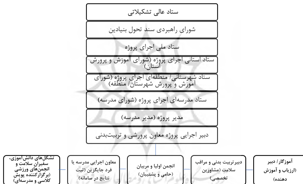
شکل ۱- نمودار تشکیلاتی طرح ملی کنترل وزن و چاقی دانش‌آموزان

سالم، به اجرای این طرح در سه مرحله «درون‌دادی، فرایندی و برون‌دادی» اقدام شود (برنامه عملیاتی طرح کوچ، ۲۰۲۰، ۳). این پروژه با هدف کلی افزایش دانش و بهبود نگرش دانش‌آموزان و خانواده‌های آن‌ها در خصوص ورزش و فعالیت بدنی و نیز کمک به دانش‌آموزان در مدیریت وزن خویش و داشتن سبک زندگی سالم و فعال در طول سال تحصیلی ۱۳۹۹-۱۴۰۰ اجرا شد و یکی از مهم‌ترین اهداف اختصاصی آن کاهش ۳ درصدی تعداد دانش‌آموزان چاق و دارای اضافه‌وزن می‌باشد که برای تحقق این هدف ساختار تشکیلاتی عوامل اجرایی دخیل در طرح فوق در سطوح ستادی، استانی، منطقه‌ای و مدرسه‌ای به شرح شکل ۱ پیش‌بینی شد: