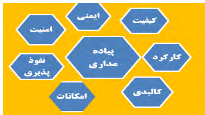
شکل ۱. متغیرهای پژوهش