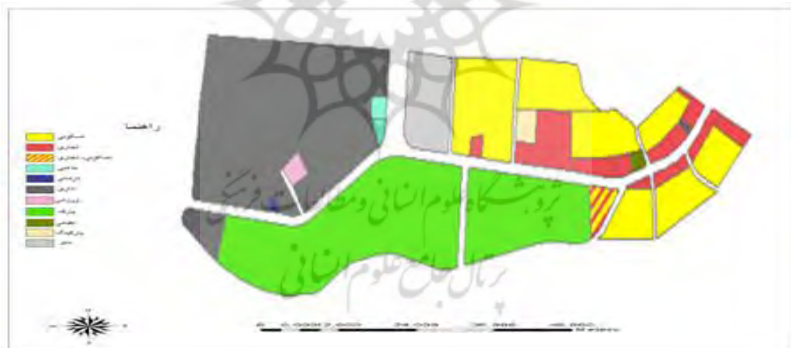
شکل ۴. توزیع کاربری‌های مجاور بلوار شهید رزاقی شهر رامسر