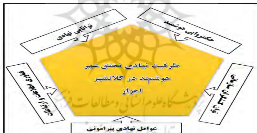
شکل ۲: مدل مفهومی تحقیق

هستند. با این حال، هر دسته از بازیگران اهداف متفاوتی را دنبال می‌کنند و این اهداف چشم‌انداز آن‌ها از شهر هوشمند را تحت تأثیر قرار می‌دهند. (دامری، ۱۳۹۷: ۵۷)؛ اما در کشورهایی با سیستم حکومتی متمرکز، دولت به‌عنوان یک کنشگر فرادستی، در دسته‌بندی جداگانه مورد توجه خاص در بحث نهادی قرار می‌گیرد. در واقع، دولت اغلب در ارتباط با شهرهای هوشمند با محدودیت‌های مالی مواجه هستند و نهادهای محلی تحت تأثیر سیاست‌های تأمین مالی توسط دولت قرار می‌گیرند و گاهی اوقات اصلاً فاقد طرح شهر هوشمند هستند (European Commission, 2013:20-42). حال در کشوری تک‌محصولی مبتنی بر نفت و در شهری نفت‌خیز که نهادهای نفتی چه به لحاظ فضایی