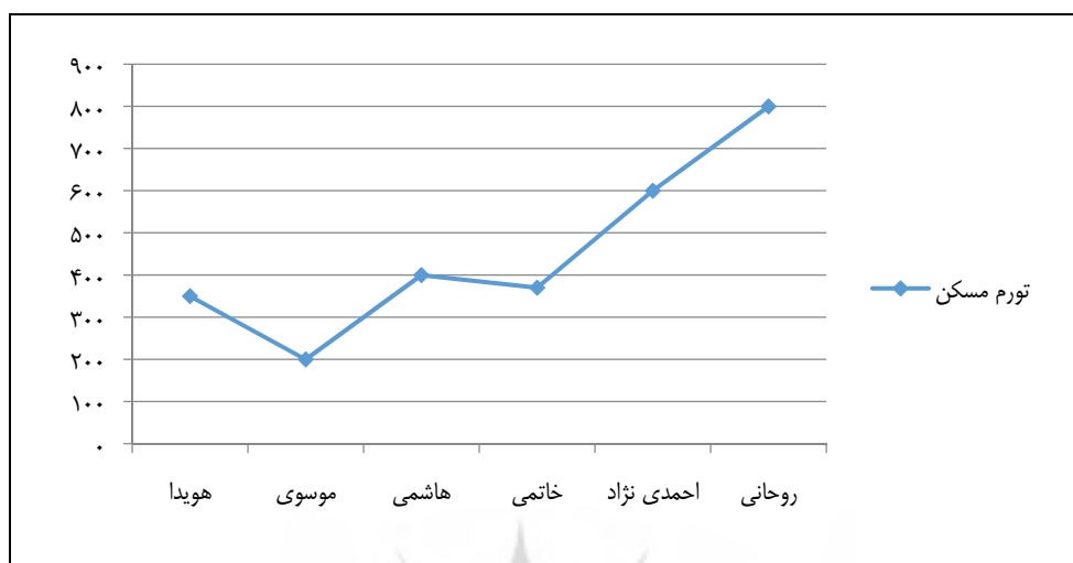
شکل ۳. تورم بخش مسکن از دولت هويدا تا روحانی

قیمت مسکن در همین حدود)، اما در سال‌های انتهایی خود باز هم تجربیات قبلی را تکرار نموده و در طی هشت سال، تورم این بخش را به ۸۰۰ درصد رساند (شکل ۳).