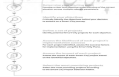
شکل ۵. مدل ارائه شده شهر هوشمند - انستیتو بین‌المللی توسعه مدیریت IMD

انستیتو بین‌المللی توسعه مدیریت IMD، مدل شهر هوشمند را به شکل زیر ارائه کرده است: