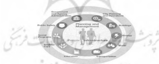
شکل ۳. مدل ارائه شده شهر هوشمند - شرکت IBM

شرکت IBM مدل شهر هوشمند را در سال ۲۰۱۵ به شکل زیر ارائه کرده است.