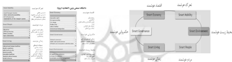
شکل ۱. مدل ارائه شده شهر هوشمند - دانشگاه صنعتی وین (اتحادیه اروپا)