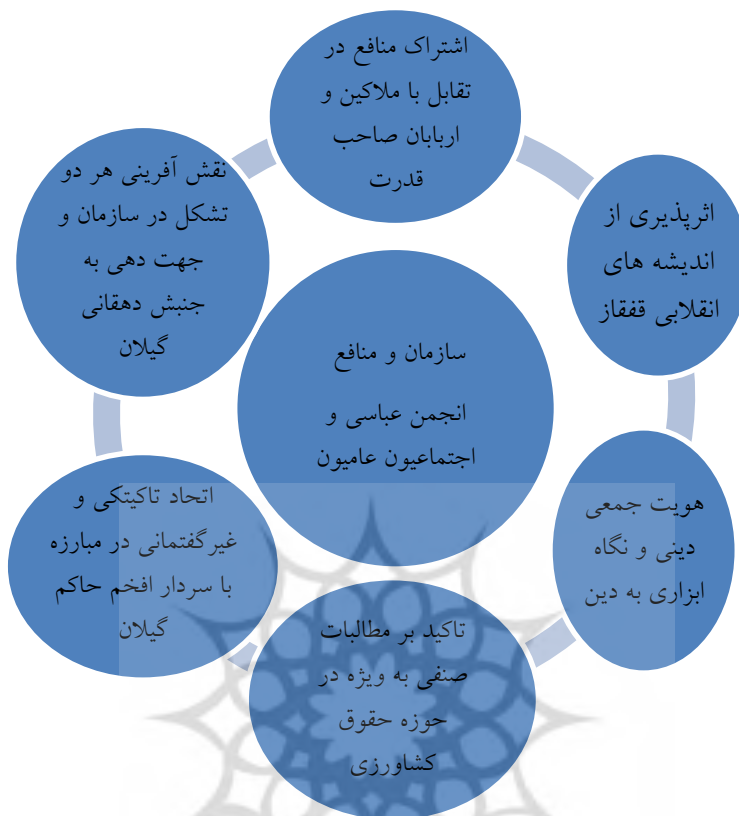
الگوی شماره دو: مدل بسیج منابع؛ سازمان و منافع