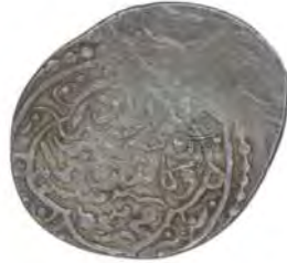
سکه علی موید، محل ضرب نامشخص، تاریخ ضرب ۷۸۰ هجری قمری، ، شماره اموال: ۳۰۰۰۰۰۶۰۰۱۱۰