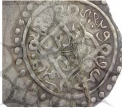
سکه علی موید، سال ۷۷۵ هجری قمری، ضرب سمنان منبع: موزه ملی ملک، شماره اموال: ۵۰۰۰۰۰۶۰۰۱۱۳۵۳