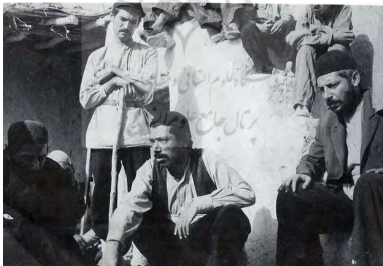
تصویر شماره ۱: فیلم گاو