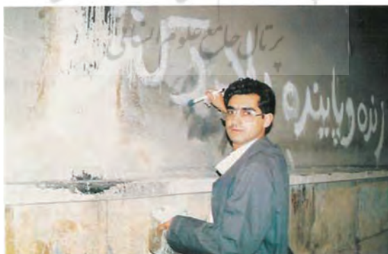
تصویر شماره ۲: فیلم درخت گلابی