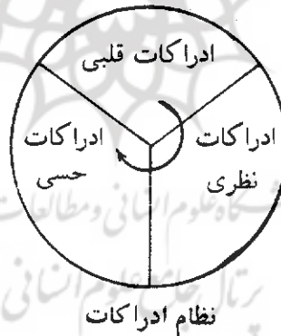
نمودار شماره (۱)

قائل شدن به محدودیت شناخت و ادراک به هر یک از مراتب سه گانه ادراک (ادراکات قلبی، نظری، حسی) موجب نقض شناخت و ادراک بشر می‌باشد زیرا هر کدام از اینها دارای قلمرو خاصی هستند که دیگری در آن راه ندارد. البته قائل شدن به قلمروهای متفاوت ادراکات قلبی، نظری، حسی به معنی نفی ارتباط بین آنها نیست بلکه ارتباطی تنگاتنگ و متقابل بین آنها برقرار است و همگی آنها در «ذهن» جای می‌گیرند، که هر سه مرتبه آن با هم ارتباطات منظم و منسجم داشته و یک کل واحد و نظام هماهنگ را تشکیل می‌دهند، که در آن، ادراکات قلبی،