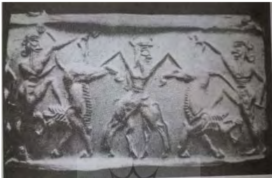
تصور شماره ۱: مَهر استوانه‌ای کشف شده از شهر اور (کرامر ۱۳۹۱: ۲۶۸)

و دیگری هم‌اورد او، موجودی نیمی گاو و نیمی انسان (بالاتنه آن انسان و پایین تنه اش گاو) است. جالب‌تر آنکه این موجود در حال نبرد و کشتن دو اژدها است. پیش از این درباره وابستگی شخصیت اساطیری فریدون به توتم و نماد گاو اشاره‌های بسیاری شده است و در کتاب‌ها و مقالات فراوان این وابستگی بارها اشاره شده و به اثبات رسیده است؛ چه از دایگی گاو برمایه یا گرز گاوسار فریدون و یا حتی نسبت دادن نام درفش کاویان به پرچم گاو شکل و نه پرچم کاوه. (اکبری مفاخر ۱۳۹۵: ۱۴-۱۵) پس پر بیراه نیست که این تصویر را نمادی از فریدون در حال نبرد با اژی‌دهاک بدانیم. البته که منظور، اسلاف اساطیری این دو نام (فریدون و اژی‌دهاک) می‌باشد؛ زیرا این نام‌ها عناوینی است که در هزاره‌های بعدی بر این شخصیت‌های اسطوره‌ای نهاده شده است، اما منظور ما بن‌مایه‌های اساطیری کهن است؛ گرچه در گذر زمان نام‌ها و پوسته جدیدی به خود می‌گیرند، اما صفات و کردارشان تقریباً ثابت می‌ماند.