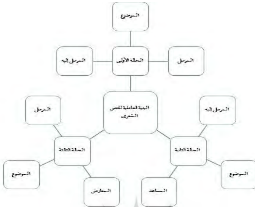
ترسيمة البنية العاملية للنص وفق منهج عصام واصل (واصل، ٢٠١٣م، ص ٢٤)

والبنية العاملية للنص رديف لدراسة الشخصيات في السردية؛ والظاهرة العامة المسيطر على علاقات الشخصيات أو العوامل في البنية العاملية للنص هي علاقة الصراع والتضاد بين العوامل. وتطرح البنية العاملية في الكتابات السيميائية لغريماس والبنية العاملية ترتبط بالنص السردية، و«قد توصل غريماس في سيميائه إلى هذه البنية العاملية في صوتها هذه اعتمادا على أعمال بروب وستراوس» (قوراري، ٢٠١٥م، ص ٣١). وواصل في منهجه ومحاولته التطبيقية على نصوص المقالح، قام في جزء من دراسته بدراسة البنية العاملية للنص الشعري أو ما يسمى، في كتابات غريماس السيميائية، العامل وموضوع القيمة. وفق ما جاء في كتاباته السيميائية، يتجلى دور العامل المرسل في إقناع الذات بالبحث عن موضوع القيمة، والمعيق يرتبط بحالة الصراع، والمساعد يساعد الذات في البحث عن موضوع القيمة، في حين يعمل المعيق على تعطيل الذات في حصولها على موضوع القيمة (بوعيطه، ٢٠١٣م، ص ٥٢).