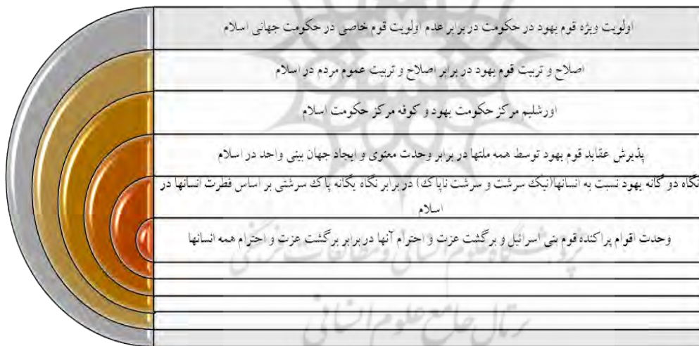
شکل شماره ۴. مهم‌ترین تفاوت‌های حکومت واحد جهانی اسلام و یهود در آینده با توجه به مباحث مطرح شده، می‌توان این چنین نتیجه‌گیری نمود که دین، آئین و مکتبی می‌تواند ادعای تشکیل حکومت جهانی در آینده را عهده‌دار شود که از ویژگی‌های زیر برخوردار باشد:

رهبری شایسته (دارای ویژگی‌های انسان کامل: عصمت، عدالت، علم، تقوا و...)