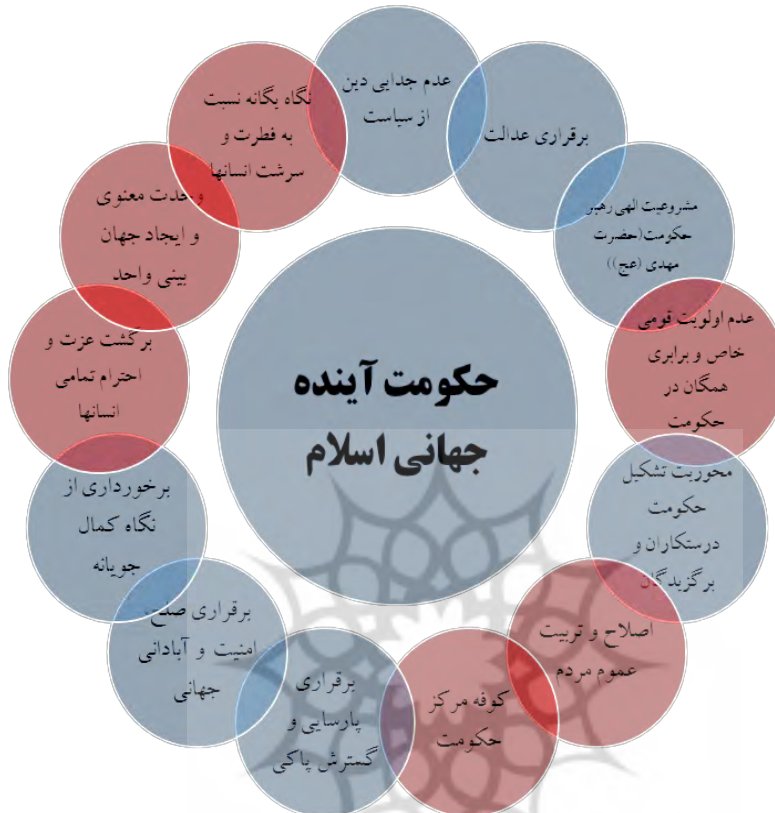
شکل شماره ۲. ویژگی‌ها و اهداف تشکیل حکومت واحد جهانی اسلام در آینده

پس از بررسی ویژگی‌ها و اهداف مدنظر حکومت جهانی یهود و اسلام که به واسطه ظهور موعود آخرالزمانی در ابعاد مختلف محقق می‌گردد، هر دو حکومت به ترتیب دارای ویژگی‌های مشترک و همچنین تفاوت‌هایی می‌باشد که به ترتیب در شکل‌های ۳ و ۴ نمایش داده شده است.