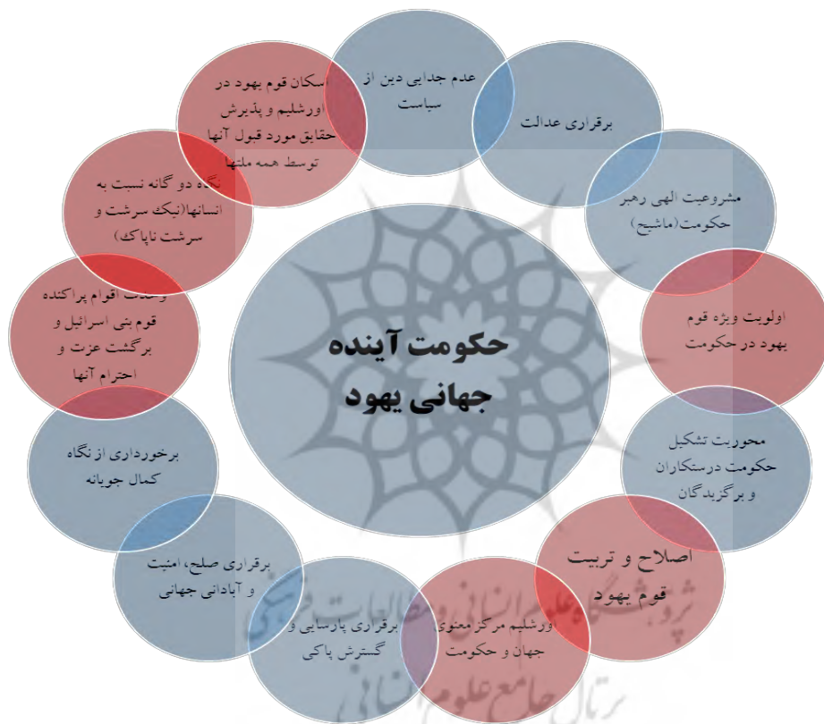
شکل شماره ۱. ویژگی‌ها و اهداف تشکیل حکومت واحد جهانی یهود در آینده

ویژگی، هفت ویژگی مشترک و شش ویژگی متفاوت می‌باشد که در شکل‌های شماره ۱ و ۲ نشان داده شده است؛ دایره‌های آبی رنگ اشتراکات و دایره‌های قرمز رنگ تفاوت در ویژگی‌ها را نشان می‌دهد: