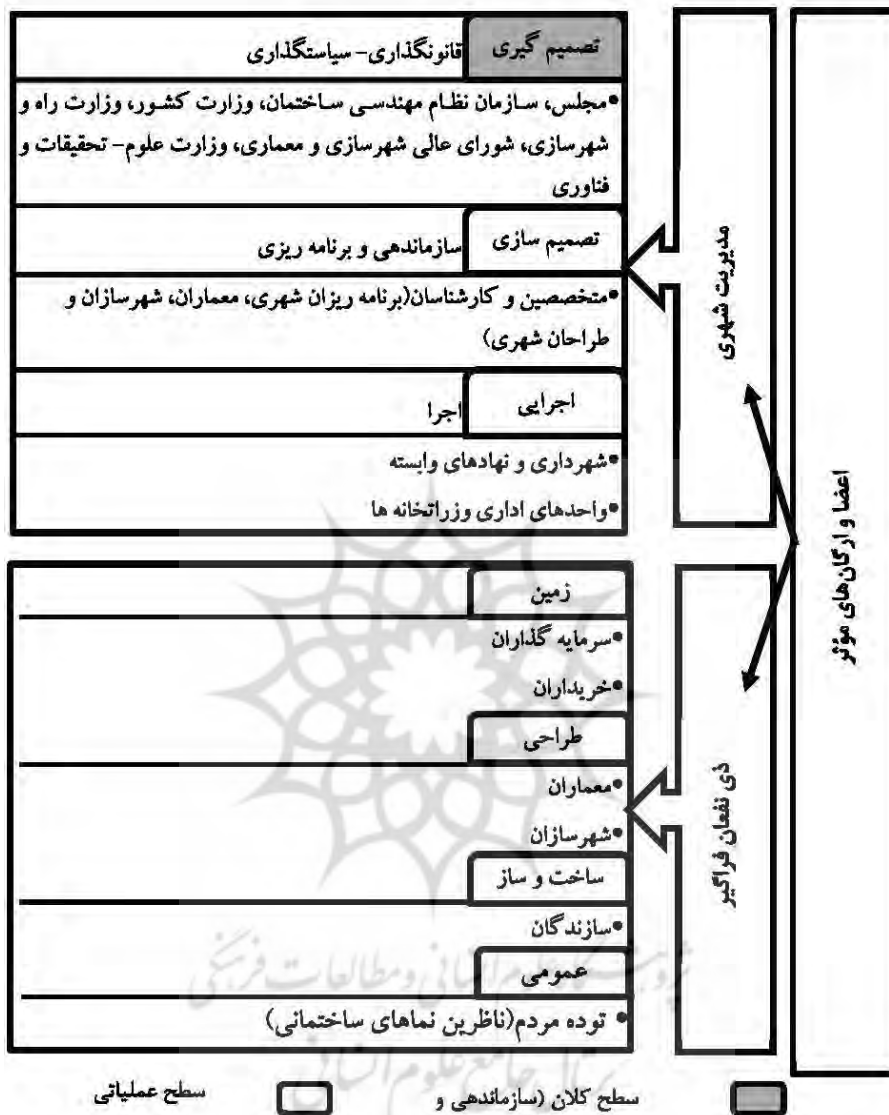
شکل ۱. اعضا و ارگان‌های مؤثر در شکل‌گیری نمای ساختمان‌های مسکونی در پژوهش حاضر