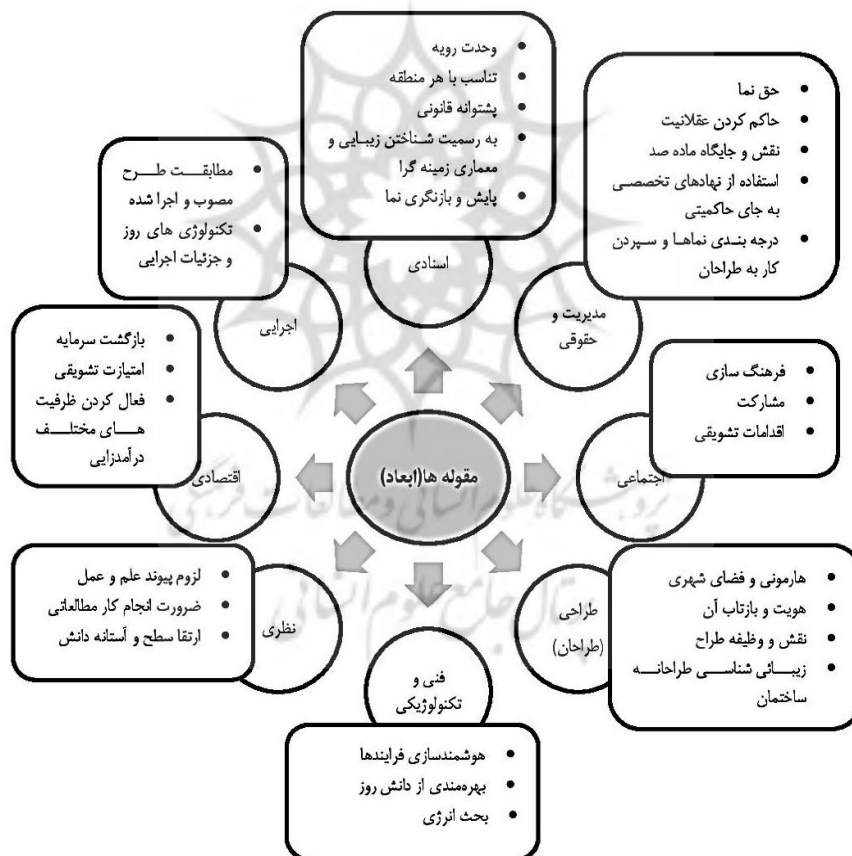
شکل ۴. شبکه مضامین (ابعاد هشت‌گانه و مقوله‌های) عوامل مؤثر بر ارتقاء نماهای مسکونی