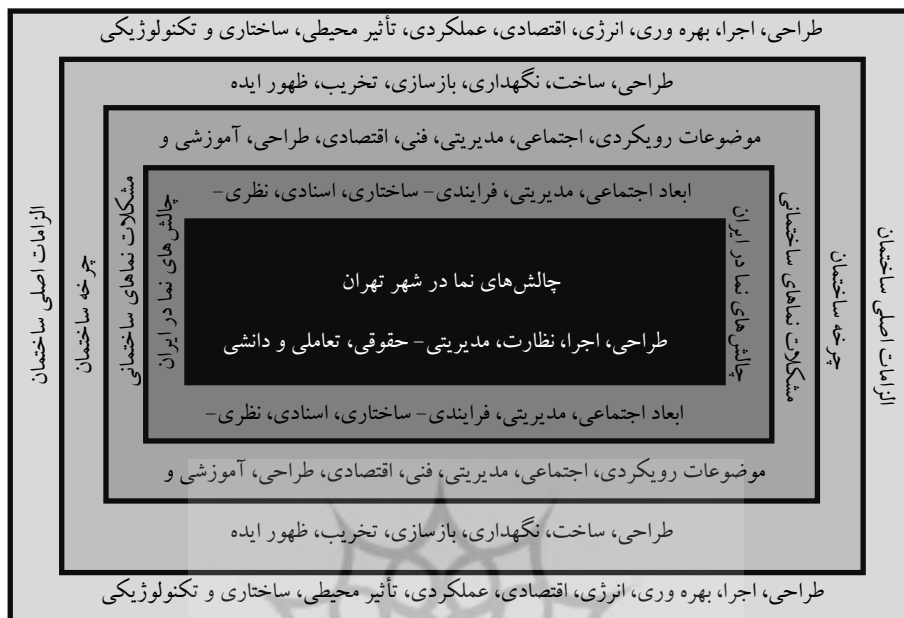
شکل ۲. سلسله مراتب ملاحظات در نظر گرفته شده جهت استخراج عوامل مؤثر بر نماهای ساختمانی