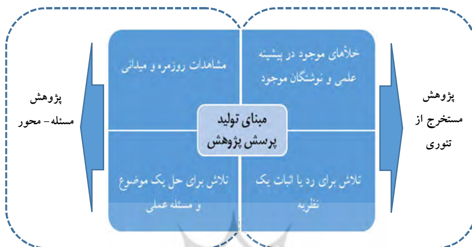
نمودار ۱- چهار منبع تولید پرسش‌های پژوهش (برگرفته از: Evans, 2007)

دیالکتیک عام و خاص، اصالت سرزمینی و بومی پژوهش: بر پایه مطالب پیش‌گفته پژوهش می‌تواند مستخرج از تئوری یا مسئله-محور باشد. با توجه به تمرکز ویژه نوشتار حاضر بر پژوهش‌های میان‌دانشی حوزه علوم انسانی و علوم محیطی (برنامه‌ریزی شهری، معماری و مانند آن) در شرایط سرزمینی-فرهنگی ایران، این پرسش کلیدی مطرح می‌گردد که کدام روش می‌تواند مبنای مناسب‌تری برای انتخاب موضوع پژوهش دکتری باشد. در شرایطی که دانش از خاستگاه سرزمینی می‌جوشد، افتراقی میان نظریه و عمل نیست و مرز میان پژوهش مسئله-محور و پژوهش مستخرج از تئوری کم‌رنگ می‌شود. بنابراین حتی اگر پرسش‌های پژوهش بر پایه خلائهای موجود در پیشینه علمی و یا در تلاش برای رد یا اثبات یک نظریه تعریف شوند، این حفره‌های موجود در نوشتگان مرتبط یا نظریه‌های به آزمون گذاشته شده جدای از چالش‌ها و مسائل عملی موجود نبوده و از این رو، به‌سختی می‌توان یکی از دو رویکرد مسئله-محور یا مستخرج از تئوری را بر دیگری ترجیح داد. شرایط زمانی بغرنج می‌شود که ارتباط میان پژوهش