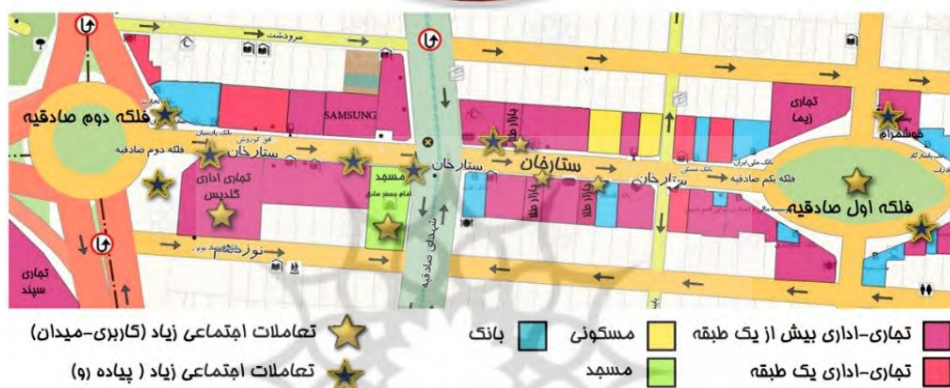
شکل ۱- کاربری‌های محدوده مطالعاتی و درصد فراوانی آن‌ها

نقش کاربری‌ها به خصوص فضاهای تجاری در شکل‌گیری چهار مؤلفه اصلی