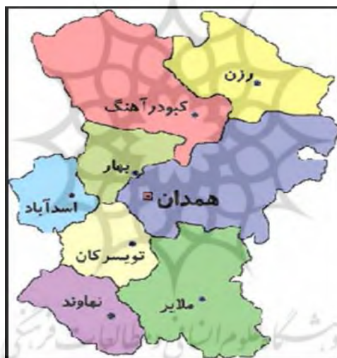
شکل ۲- نقشه استان همدان

استان همدان با مساحت ۱۹۴۹۳ کیلومتر مربع و جمعیت ۱،۷۵۸۲۶۸، یکی از استان‌های غربی کشور است که از شمال با استان‌های زنجان و قزوین، از سمت جنوب به استان لرستان، از غرب به استان‌های کردستان و کرمانشاه و از سمت شرق با استان مرکزی همسایه است. این استان بین مدارهای ۳۳ درجه و ۵۹ دقیقه تا ۳۵ درجه و ۴۸ دقیقه عرض شمالی از خط استوا و ۴۷ درجه و ۳۴ دقیقه تا ۴۹ درجه و ۳۶ دقیقه طول شرقی نصف‌النهار گرینویچ واقع شده است و شامل ۹ شهرستان، ۲۵ بخش، ۲۷ شهر، ۷۳ دهستان و ۱۱۲۰ روستا است.