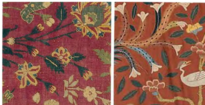
تصویر ۴: درهم تافتگی گیاهان در یک بافته چینی مربوط به قرن ۱۵ میلادی و فرش ابریشمی شکارگاهی منتسب به کاشان