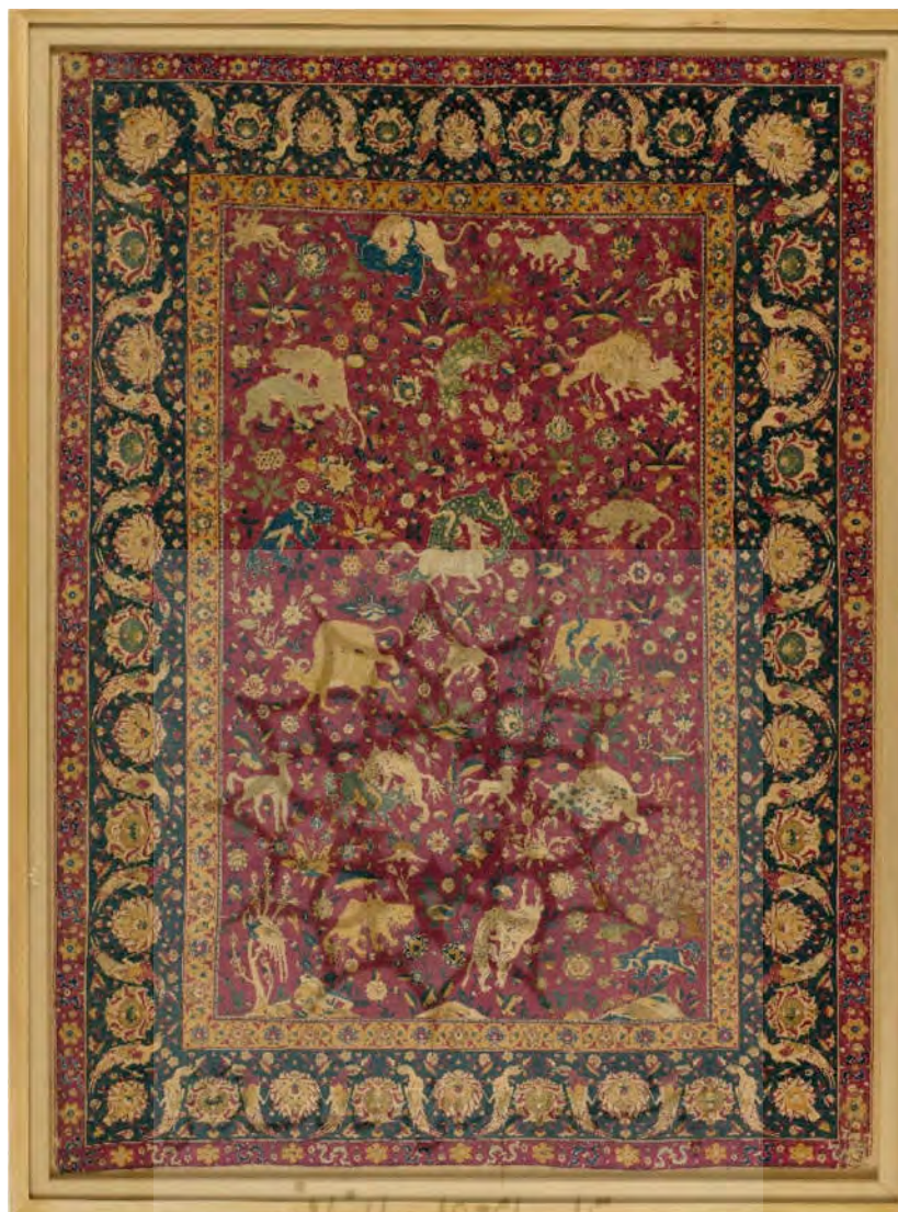
تصویر ۲: فرش ابریشمی شکارگاهی متناسب به کاشان مربوط به دوره صفوی

( https://www.metmuseum.org/art/collection/search/446642 )