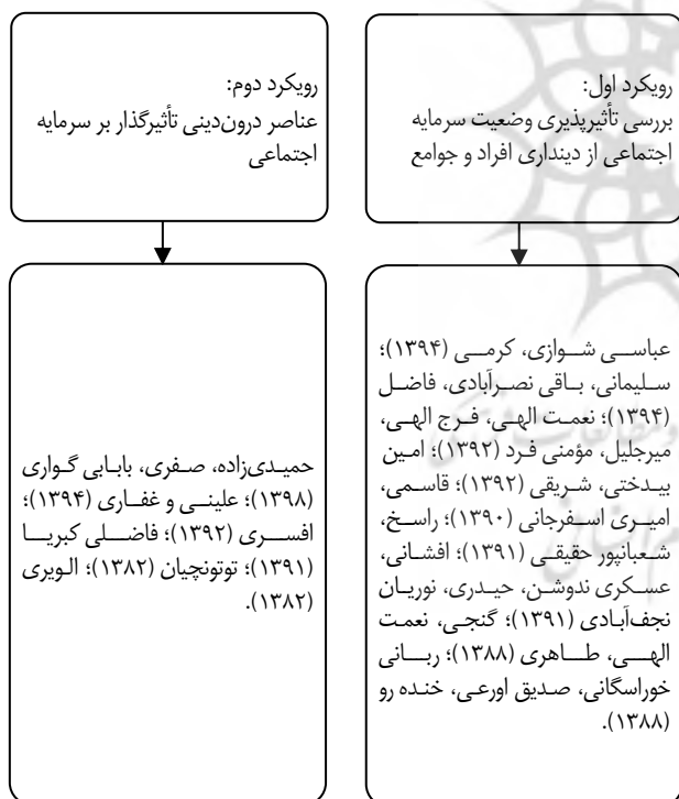
نمودار ۱: پیشینه پژوهش‌های دینی در حوزه سرمایه اجتماعی (برگرفته از یافته‌های پژوهش)

نمودار ۱، به اختصار به برخی از پژوهش‌های مطرح‌شده ذیل این دو رویکرد اشاره می‌کند.