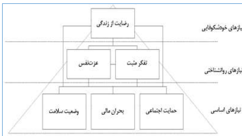
شکل ۱. الگوی استخراج‌شده از نظریه مزلو

بر این اساس، سه متغیر حمایت اجتماعی، بحرانی مالی و وضعیت سلامت به‌عنوان نیازهای اساسی و متغیرهای پیش‌بین، دو متغیر تفکر مثبت و عزت‌نفس به‌عنوان نیازهای روان‌شناختی و متغیرهای میانجی و رضایت از زندگی به‌عنوان نیاز خودشکوفایی و متغیر ملاک در الگوی مفهومی این پژوهش قرار گرفته‌اند. مهم‌ترین متغیر این الگو که به‌عنوان نیاز خودشکوفایی زنان میان‌سال مطرح شد، رضایت از زندگی است. بر اساس شواهد پژوهشی رضایت پایین از زندگی سبب ایجاد تنش می‌شود و برخی از افراد برای رفع تنش از روش‌های مختلفی استفاده می‌کنند (تاناکا و همکاران ۱ ، ۲۰۱۴). رضایت از زندگی زنان میان‌سال زمینه مساعدی را برای سلامت روانی و توانمندی آنها در حوزه خانواده و جامعه فراهم می‌کند، و آثار آن نه‌تنها در ابعاد مختلف زندگی خود زنان که نیمی از ساختار اجتماعی ایران را تشکیل داده‌اند، بلکه در سطح خرد و کلان و در حوزه‌های مختلف جامعه نمود می‌یابد. از سویی، نارضایتی زنان میان‌سال از زندگی و تجارب منفی مانند فشار روانی، افسردگی و اضطراب هم بر زندگی فردی و اجتماعی زنان و هم بر حضور آنان در عرصه‌های مختلف مانند فرهنگی، علمی، اقتصادی، اجتماعی، سیاسی در جامعه اثرگذار است. لذا مطالعه رضایت از زندگی زنان میان‌سال با توجه به مشکلات خاص این قشر و بحران میان‌سالی ضروری می‌نماید. با این وجود پژوهش‌های مرتبط با حوزه رضایت