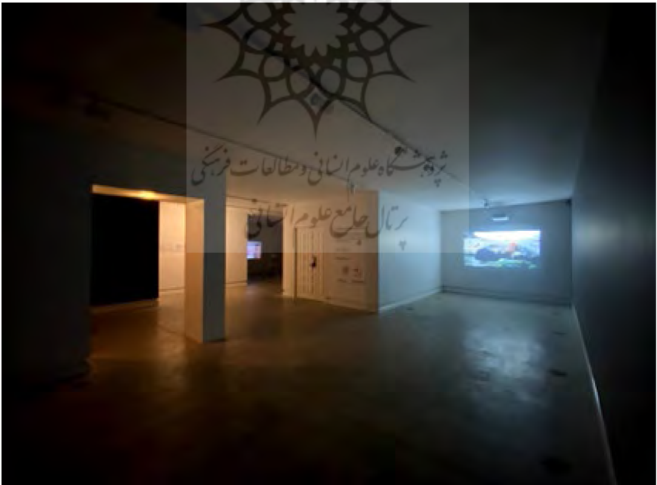
تصویر ۴. رویداد ویدیویی پادمان، کیوریتور: فواد علیجانی، ۱۴۰۰

راستی: هر مخاطبی با گزاره‌ای پیشینی با یک نمایشگاه