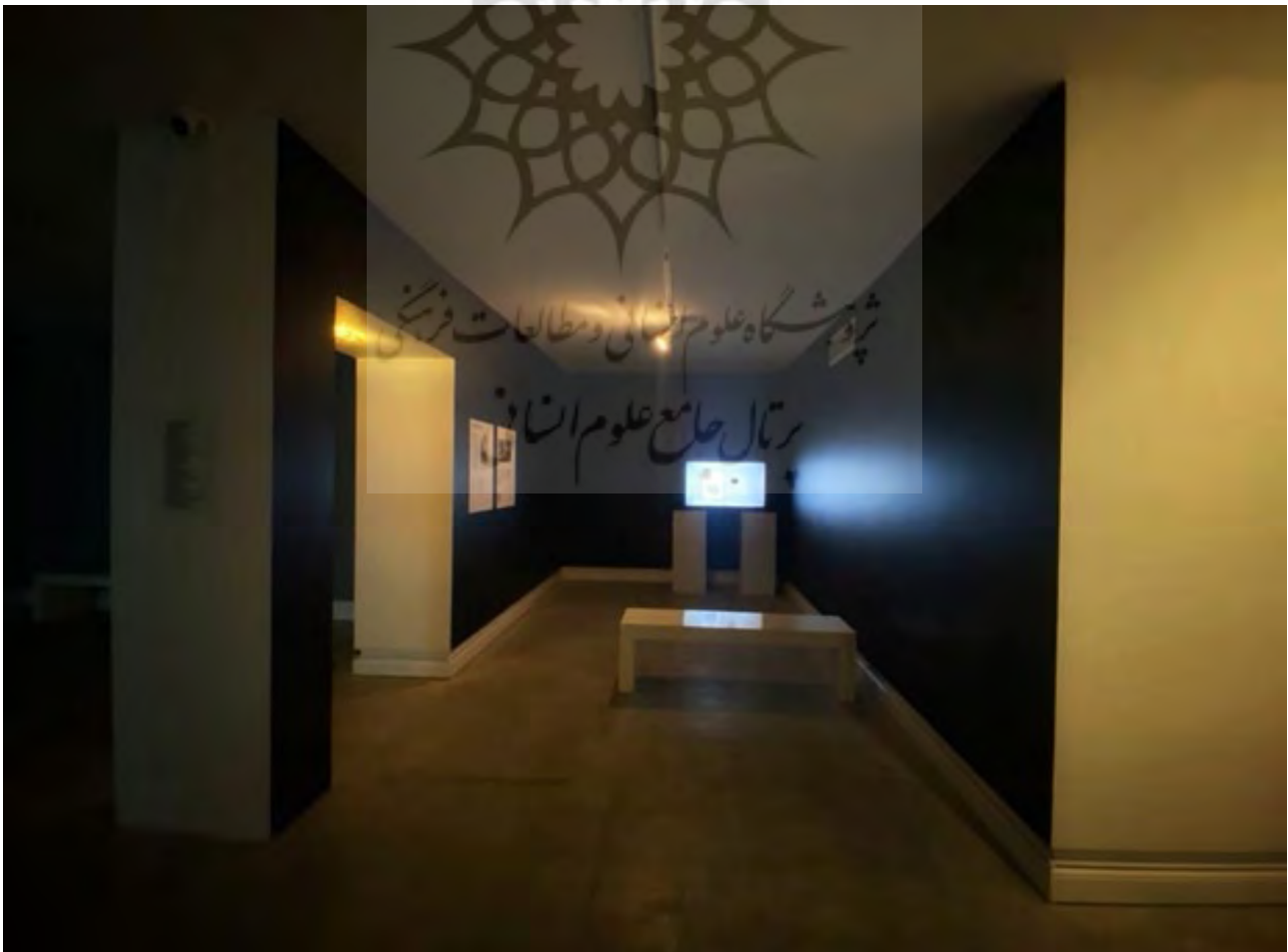
تصویر ۶. رویداد ویدیویی پادمان، کیوریتور: فواد علیجانی، ۱۴۰۰

راستی: از آنجایی که شروع کار در گالری شریف با اوج این همه‌گیری مصادف شد و طبیعتاً بر میزان بازدیدکننده‌های