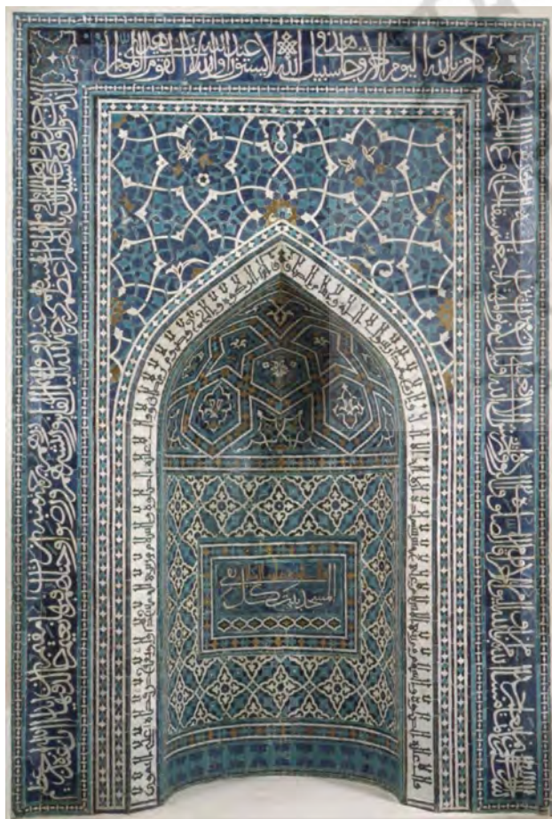
تصویر ۱. محراب، اصفهان، قرن چهاردهم، موزه هنر متروپولیتن.

بین این توضیحات - و توضیحات احتمالی دیگر - انتخاب دشوار است. برخی ممکن است بیشتر از سایرین برای یک زمان، منطقه یا موقعیت اجتماعی قابل‌قبول باشد. در مجموع این توضیحات غنای زیباشناختی هنر اسلامی را نشان می‌دهند، اما شاید به‌طور قابل‌توجهی، سؤالاتی اساسی در مورد ماهیت درک بصری و لذت و همچنین در مورد فرآیندی که با آن به خلاقیت هنری دست می‌یابند،