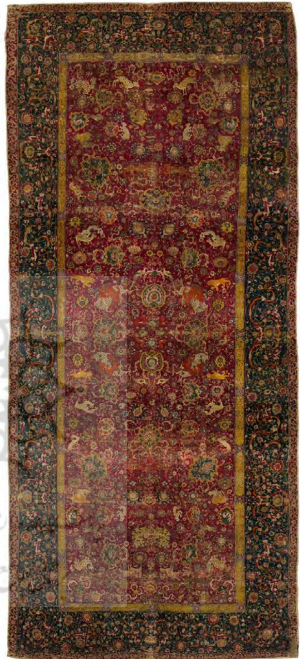
تصویر ۸. فرش امپراتور، قرن شانزدهم، موزه هنر متروپولیتن.