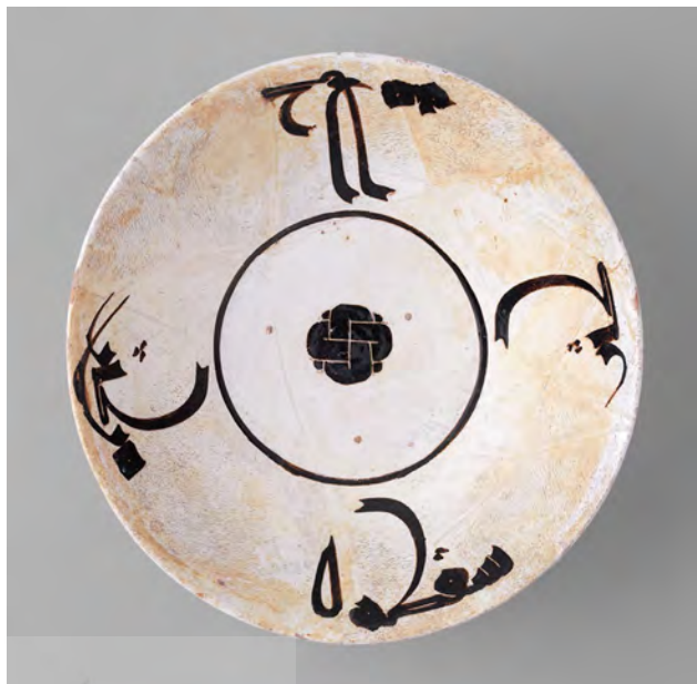
تصویر ۴. کاسه سرامیکی، نیشابور، اواخر قرن نهم و اوایل قرن دهم، موزه هنر متروپولیتن.