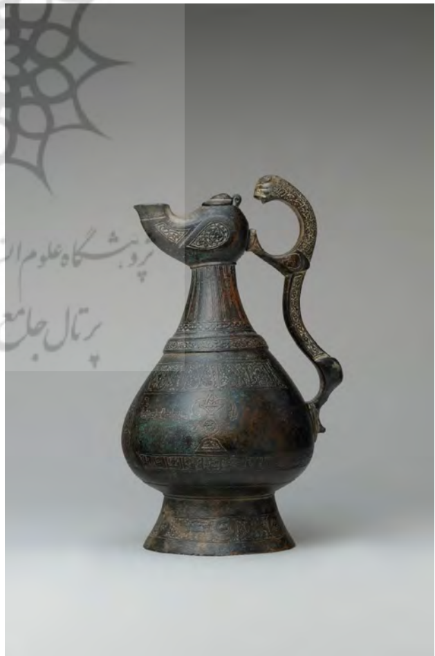
تصویر ۵. ابریق برنجی، نقره کوب، اواخر قرن دوازدهم، موزه هنر متروپولیتن.