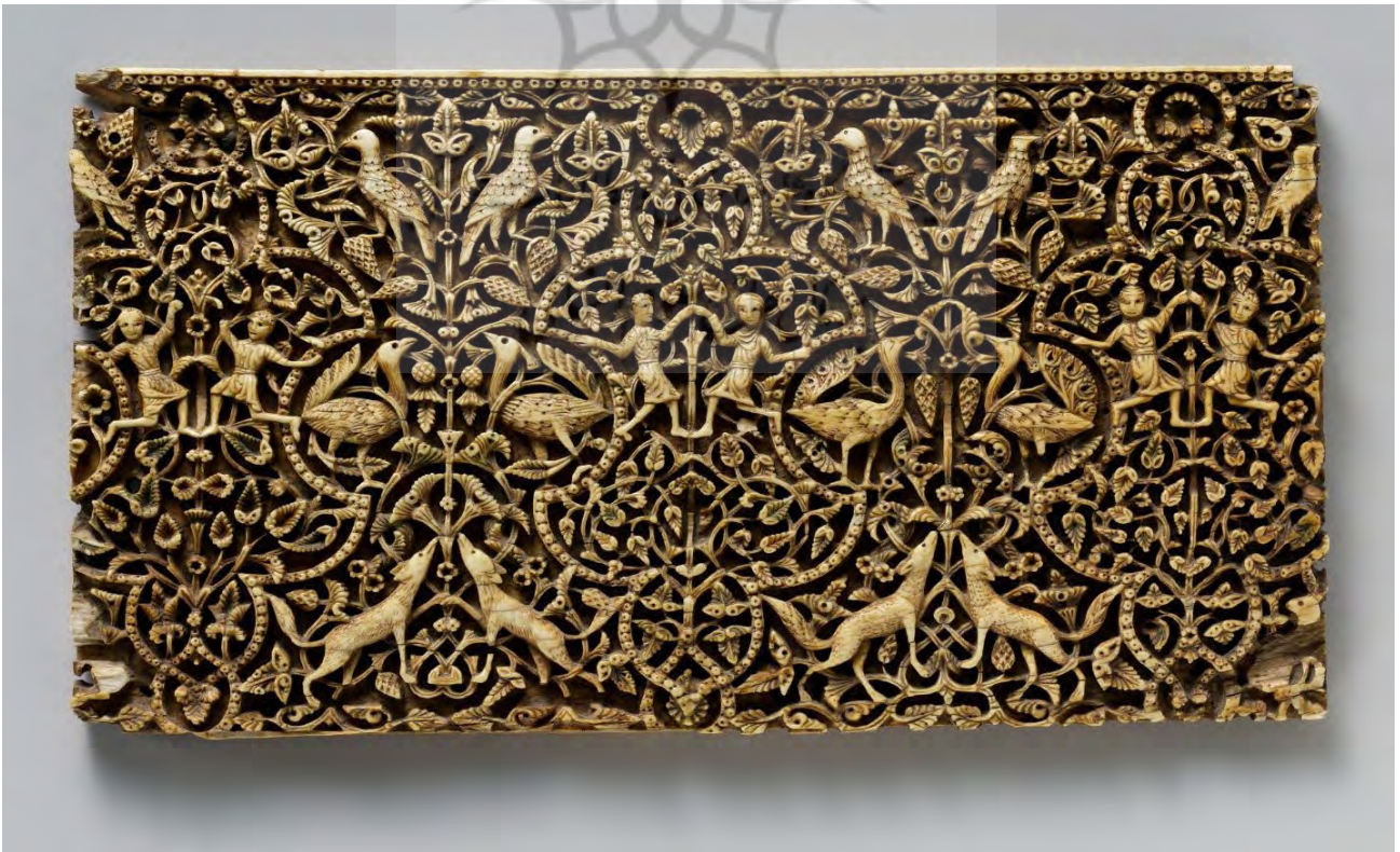
تصویر ۳. لوح عاجی، اسپانیا، قرن یازدهم، موزه هنر متروپولیتن.