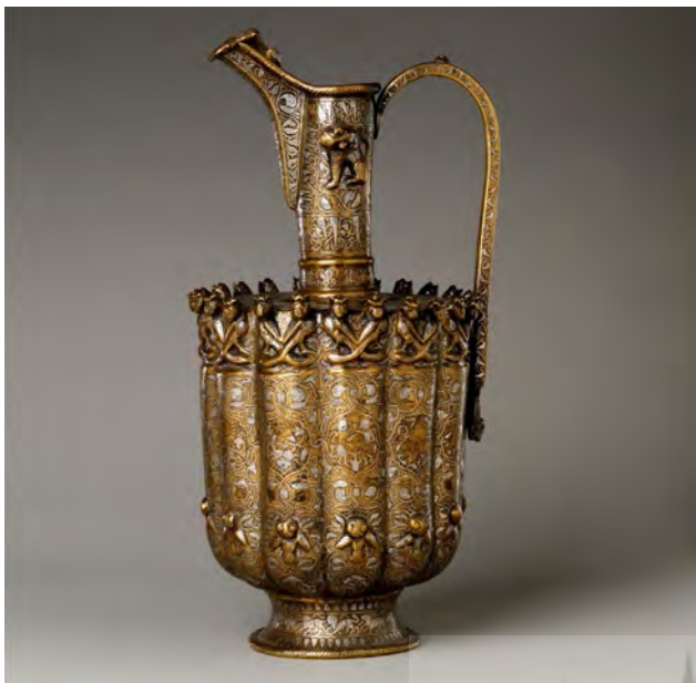
تصویر ۶. ابریق برنجی، نقره کوب، شرق ایران، دوره سلجوقی، قرن سیزدهم، موزه هنر متروپولیتن.