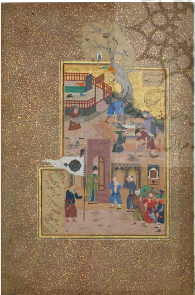
تصویر ۷. نگاره منسوب بهزاد، برگي از منطق الطير عطار، ایران، مکتب هرات، موزه هنر متروپولیتن.