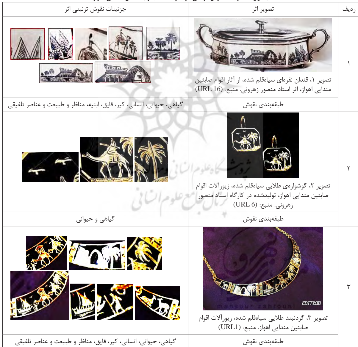
جدول ۲: جزئیات نقوش تزئینی در آثار سیاه‌قلم قوم صابئین مندایی اهواز

حقیقت مطلق است. (الیاده، ۱۳۷۶: ۲۶۱) در اعتقادات مندائیان، از جمله اولین درختانی که فرشته الهی ملکا هیول زیوا با اذن خداوند به وجود آورد درخت خرما بوده است و حتی این فرشته در زمان اتمام مأموریت آفرینش نباتات و هنگام بازگشت به عالم انوار از درخت خرما توشه و متاع خود را می‌گیرد و راهی عالم انوار و جایگاه خداوند می‌شود. هم‌چنین در زمان حضور خود در زمین نیز از میوه درخت خرما تناول می‌کند. بنابراین درخت خرما در نزد مندائیان محترم و مقدس است و پاک شمرده می‌شود. حتی در مراسم رسمی و جشن‌ها و اعیاد خود نیز از خرما برای نذورات و