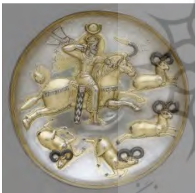
تصویر ۱: بشقاب نقره‌ای شکار قوچ، مزین به سیاه‌قلم با تصویر شکار شاه، قزوین، قرن ۵ و ۶ بعد از میلاد، موزه‌ی متروپولیتن.

است. پلینی ۴ در مورد قدمت سیاه‌قلم معتقد است که مبدع این فن مصریان باستان بوده‌اند و شهر میسین (۱۵۰۰ پیش از میلاد) را از اولین مناطقی مطرح می‌کند که سیاه‌قلم در آن یافت شده است. (پلندریت و ورنر، ۱۳۹۱: ۲۷۶-۲۷۵) شواهد نشان می‌دهد آثار زیادی از سیاه‌قلم متعلق به این دوران در دست نیست. اما شاید بتوان اذعان داشت که این هنر منشاء شرقی دارد که بعدها به اروپا منتقل شده است ۵ و این احتمال وجود دارد که سیاه‌قلم در اواخر عصر آهن در سراسر اروپا گسترش یافته است. (URL 11) قدمت این هنر در ایران باستان نیز به دوره ساسانیان بازمی‌گردد و نمونه‌هایی متعلق به ادوار اسلامی نیز در دسترس است و اوج این هنر را در میان آثار هنرمندان سلجوقی می‌توان مشاهده کرد و در آثار دوره‌های دیگر هم نمونه‌هایی از هنر سیاه‌قلم به دست آمده است در تصاویر ۱ و ۲ به نمونه‌ای از هنر سیاه‌قلم دوره ساسانی و اوایل دوره اسلامی اشاره شده است: