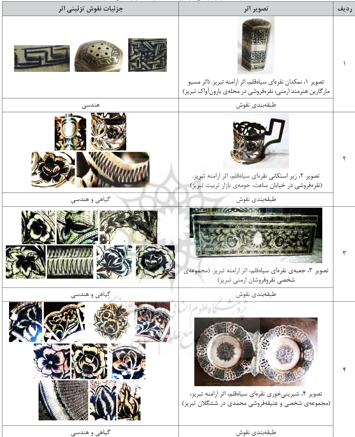
جدول ۱: جزئیات نقوش تزئینی در آثار سیاه‌قلم ارامنه تبریز (منبع: نگارندگان)