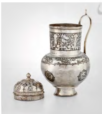
تصویر ۲: ظرف سرپوشیده سیاه قلم، نیمه‌ی اول قرن دوازدهم، (قرون ۱۰۴۰ - ۱۲۵۰ میلادی)، ایران و آسیای مرکزی. منبع: (URL 4)