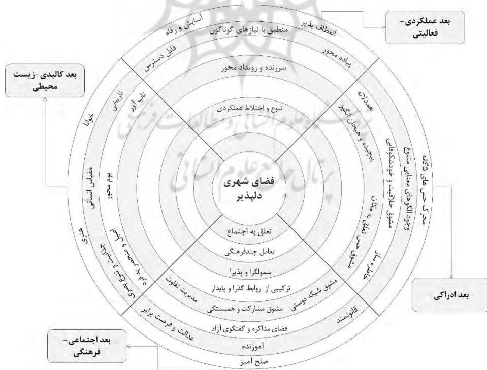
شکل ۱. مدل مفهومی کیفیت دلپذیری در فضاهای شهری

با مقایسه نمودار شماره ۳ با مدل مستخرج از رساله خلیقی ۱۳۹۷، می‌توان بیان داشت که مدل نهایی رساله مذکور، به دلیل کاربرد استراتژی داده‌بنیاد در پژوهش و استخراج مفاهیم از بستر کالبدی خاص، قابلیت تعمیم به سایر فضاهای شهری را نداشته و بیشتر در زمینه بازارهای سنتی قابل استفاده است. برخی از مقولات مستخرج از این رساله همچون وقوع و گرامیداشت رویدادهای خاص مذهبی و فرهنگی، وجود قوانین و هنجارهای اجتماعی خاص بازاریان و فضایی مملو از کرامات انسانی، کاملاً از بستر فضایی بازار استخراج شده و لذا با ماهیت سایر فضاهای شهری به طور عام، متفاوت است. همان‌گونه که پیش از این نیز ذکر شد، ماهیت این مقاله، مطالعه عمیق ادبیات جهانی و استخراج مدلی عام در حوزه پژوهش فضاهای شهری است که در انتها به مقوله‌بندی متفاوت نسبت به مدل نهایی رساله، منتج شده و می‌تواند در فضاهای متعدد مورد استفاده قرار گیرد. همچنین توجه به ابعاد زیست‌محیطی در مدل نهایی این مقاله نسبت به مدل پژوهش خلیقی (۱۳۹۷)، پررنگ‌تر است. این امر در بخش مفاهیم مستخرج در جدول شماره ۲ در قالب بعد کالبدی- زیست‌محیطی، با کمک مفاهیم فضای دوستدار محیط‌زیست، بوم‌ساز و در قالب مقوله بوم‌محور، مورد تأکید قرار گرفته است.