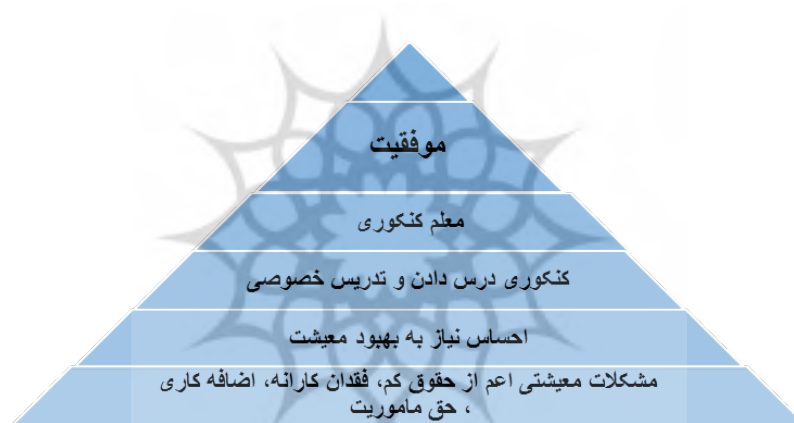
رسم توضیحی ۲ - مدل ساختار منتج به کنکوری شدن معلمان

چنانچه در نمودار ۱ دیده می‌شود، ایستایی شغلی و فقدان چشم‌انداز برای دستیابی به سمت‌های بالاتر، معلمان را برای لابی‌گری و کسب پست به صرافت انداخته است.