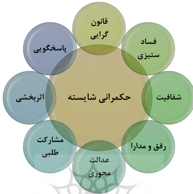
شکل ۱- ویژگی های حکمرانی شایسته (درخشه و موسوی نیا، ۱۳۹۷)