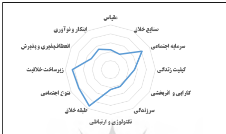
شکل ۱- رتبه بندی هر یک از ابعاد گردشگری خلاق

جاذبه‌های تاریخی و گردشگری و غیره از پتانسیل خوبی برای تبدیل شدن به یک شهر خلاق برخوردار می‌باشد. با توجه به ظرفیت‌های موجود و مزیت‌های رقابتی این شهرستان، از طریق تقویت شاخص‌های شهر خلاق و همچنین شناسایی، ایجاد و پرورش ایده‌های خلاق، مدیران و برنامه‌ریزان شهری خواهند توانست شرایط و زمینه تبدیل شهر زابل به سمت گردشگری خلاق را فراهم نمایند.