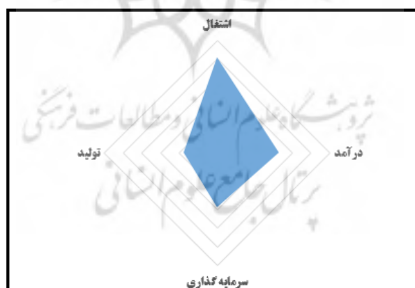
شکل ۴- میزان تأثیرپذیری گردشگری خلاق در مؤلفه‌های اقتصادی شهر زابل