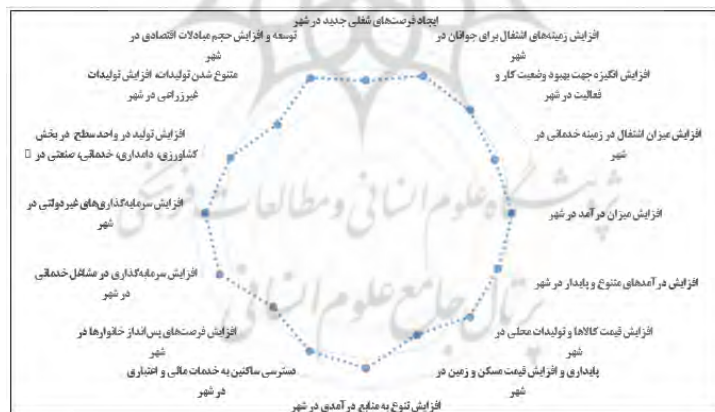
شکل ۲- میزان ارتباط بین گردشگری خلاق و شاخص‌های توسعه پایدار (اقتصادی)

ضریب ۰/۴۳۲، کمترین میزان تأثیرپذیری را از گردشگری خلاق به خود اختصاص داده‌اند. توسعه صنعت گردشگری خلاق در شهر زابل می‌تواند عاملی مهمی در رشد اقتصادی و پایداری درآمدی این شهر باشد. البته این تأثیر یک تأثیر صددردصدی و مطلق نیست ولی به شکل جدی می‌توان ادعا کرد که گردشگری خلاق گام مهمی در جهت تزریق سرمایه و تقویت اقتصاد محلی شهر زابل خواهد بود. توسعه