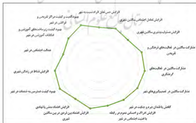
شکل ۳- میزان ارتباط بین گردشگری خلاق و شاخص‌های توسعه پایدار (اجتماعی)