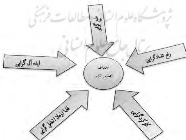
شکل شماره (۳): اثر گذاری ستون های تفکر تریز بر اهداف تولید ناب

مطالعه ی ادبیات ناب و تریز ابعاد مختلفی از همسویی اهداف دو تکنیک را روشن می سازد و مبنا قرار دادن و بکارگیری ستون های تفکر تریز می تواند تا حد زیادی منجر به دستیابی اهداف اصلی تولید ناب که همان ارزش آفرینی و حذف اتلاف هستند، گردد. چنانکه کارکردگرایی و ابزارهای مرتبط با آن می تواند ارزش های اساسی مورد نظر مشتریان را تعیین کند، ایده آل گرایی می تواند چگونگی دستیابی به آن ارزش ها را در قالب روش، محصولات و یا خدمات ایده آل تعریف کند. فضا / زمان / تعامل گرایی با کشف روابط علت و معلولی و رفع تضادگرایی با شناسایی تضادهای موجود در سیستم های فنی دارد، با اجتناب از مصالحه های مرسوم در سایر روش ها، اتلاف های موجود را شناسایی کرده و سعی در رفع آنها داشته باشند. منبع گرایی نیز تلاش می کند به طور پیوسته منابع موجود در دسترس سیستم را شناسایی نموده تا با استفاده از آنها ارزش مورد انتظار مشتریان را حداکثر سازد.