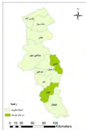
شکل ۳- نقشه سطوح توسعه‌یافتگی شهرستان‌های اردبیل به لحاظ شاخص‌های کلی توسعه