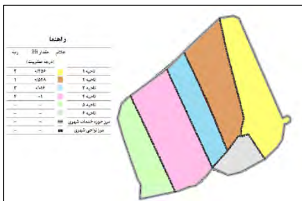
شکل شماره ۴- نقشه رتبه بندی حاصل از مدل مورد استفاده در شهر امیدیه

با توجه به جدول شماره ۷، رتبه‌بندی نواحی شهری امیدیه از نظر سه شاخص انتخابی پژوهش به این صورت است که ناحیه دو با مقدار H_i (مقدار نهایی تابع معیارگزینیه‌ها) ۰/۵۲۸ رتبه اول و به ترتیب ناحیه یک با مقدار H_i ، ۰/۴۵۶ در رتبه دوم و ناحیه سه با مقدار H_i ، ۰/۱۱۶ در رتبه سوم و ناحیه چهار با مقدار H_i ، -۱ در رتبه چهارم قرار دارند. همچنین در شکل شماره ۵، توزیع و پراکندگی نواحی رتبه‌بندی شده بر اساس مدل کداس نشان داده شده است. در روش پژوهش بیان شد که مبنای بررسی؛ دیدگاه شهروندان در ارزیابی مؤلفه‌ها در سطح نواحی شهری نمونه‌برداری شده در شهر امیدیه مؤثر بوده است؛ بنابراین ممکن است مؤلفه‌های مورد مطالعه، در بعضی زیرشاخص‌ها (متغیرها) از نظر بعد عینی با هم متفاوت باشند و عوامل دیگر سبب شده نظر پاسخ‌دهندگان تفاوت داشته باشد. به طور کلی نظرات پاسخ‌دهندگان با توجه وضعیت شاخص‌ها که در بررسی میدانی مشاهده شده است مطابقت دارد و با شرایط موجود اختلاف چندانی ندارد.