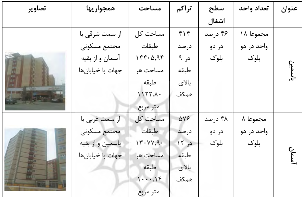
جدول ۱- ویژگی‌های مجتمع‌های مسکونی یاسمین و آسمان مراغه

شهرنشین و نیاز مبرم به مسکن، لاجرم شهروندان شهرستان مراغه نیز ناگزیر به سکونت در مجتمع‌های مسکونی خواهند شد، بنابراین بدون شک استفاده از نتایج پژوهش‌هایی از این دست، علاوه بر تضمین سلامت روان آن‌ها موجب ارتقاء میزان رضایتمندی و کیفیت زندگی‌شان نیز می‌شود.