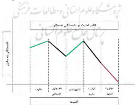
شکل ۲- مدل نهایی تأثیر مؤلفه‌های امنیت بر دلبستگی به مکان در مجتمع‌های مسکونی

نتایج حاصل از آزمون پیرسون نیز نشان داد که رابطه بین این دو متغیر به میزان 0,514 و با اطمینان 99 درصد معنادار می‌باشد، بنابراین می‌توان گفت که هرچه مؤلفه‌های امنیت در مجتمع‌های مسکونی شهرستان مراغه از وضعیت مطلوب‌تری برخوردار باشند، دلبستگی به مکان نیز به میزان چشمگیری افزایش خواهد یافت. مقایسه ضرایب همبستگی پیرسون بین مؤلفه‌های امنیت و دلبستگی به مکان نیز نشان می‌دهد که مؤلفه‌های، قلمروبندی و نظارت به ترتیب با ضرایب 0,563 و 0,548 همبستگی بیشتری با دلبستگی به مکان دارند. همانطور که انتظار می‌رفت مؤلفه قلمروبندی به دلیل شخصی‌سازی فضا برای ساکنان و نیز کاهش میزان تردد افراد ناشناس و مؤلفه نظارت به دلیل افزایش آگاهی ساکنان نسبت به اعمال مشکوک مجرمان، فرصت‌های وقوع جرم را به میزان بسیار زیادی کاهش می‌دهند، در نتیجه زمینه حضور طولانی مدت، مسئولیت‌پذیری، همکاری و مشارکت ساکنان در محیط به خوبی فراهم می‌شود که این امر در نهایت منجر به افزایش میزان احساس دلبستگی به مکان می‌شود.