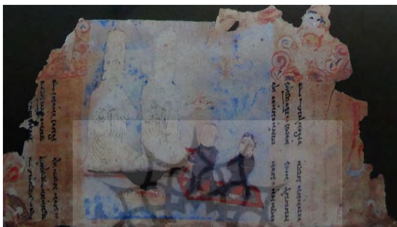
IB4974 (کلیم کایت، ۱۳۸۴: ۱۶۲)

گاه نیایش‌های جمعی با حضور تعداد اندکی برپا می‌شد. به‌عنوان نمونه در برگه مصور از یک کتاب مانوی که به مراسم توبه ۱۲ معروف است (IB4974)، شاهد برگزاری مراسم نیایشی با تعدادی از مانویان در کنار بزرگان هستیم که با موسیقی و نواختن ساز زهی همراه بوده است. (همان: ۱۲۱)