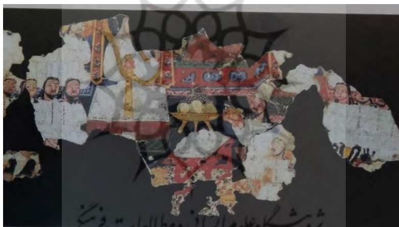
IB 4979 (کلیم کایت، ۱۳۸۴: ۱۵۵)

نیایش‌های جمعی گاه با حضور جمع زیادی از مانویان و گاه با تعداد اندکی از مانویان برگزار می‌شد. در بخش بزرگی از یک برگ نقاشی مربوط به مراسم بما (IB4979) ۱۱ تصویر مراسمی نیایشی را شاهد هستیم که به‌صورت جمعی به‌جای آورده شده است. در این مراسم نیایشی، مانویان بر اساس نقش و طبقه‌ای که به آن تعلق دارند در جایگاه خود قرار گرفته و مراسم نیایش با این تشریفات برگزار می‌شود. (کلیم کایت، ۱۳۸۴: ۱۰۹)