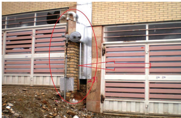
تصویر ۳- ناهماهنگی در اجرا- سایت حاج شمسعلی