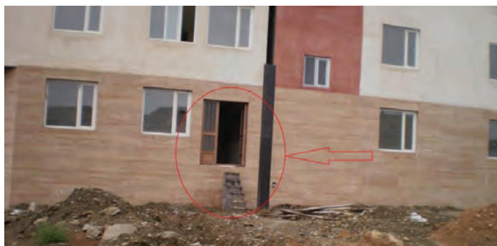
شکل ۴- نبود مکانسیم جهت هماهنگی موجب شده درب ورودی ساختمان بیش یک متر بالاتر از سطح معبر احداث شود

زیرساخت‌های شهری (چه از منظر سازمانی و چه از منظر سیستمی) به صورت متقابل به هم وابسته بوده و شبکه به هم پیوسته‌ای را تشکیل می‌دهند. وجود ارتباط متقابل بین این سیستم‌های شهری، که ناشی از این دو ویژگی است، لزوم وجود یک سازوکار معین برای مدیریت این ارتباطات را اجتناب ناپذیر می‌کند. یافته‌های این تحقیق نشان می‌دهد که فقدان یک مکانسیم مشخص برای مدیریت وابستگی‌های متقابلی که در طی فرایند تکنیکی- اجتماعی تأمین زیرساخت‌های شهری وجود دارد، منتج به چالش اجرایی متعددی گردیده است (به عنوان نمونه نگاه شود به تصویر ۴). تقریباً تمام شرکت‌کنندگان در جلسات مصاحبه رو دررو و مصاحبه‌های گروهی از نبود مکانسیم مشخصی برای ایجاد هماهنگی گلایه مند بودند. بعنوان مثال نماینده راه و شهرسازی در جلسه مصاحبه گروهی موضوع را به شکل زیر بیان نمود: "تمام سازمان‌های دخیل در فرایند تأمین زیرساخت‌های شهری برای مناطق جدید مسکونی تمایل دارند فعالیت‌هایشان را هماهنگ کنند ولی مکانسیم روشنی برای این موضوع وجود ندارد".