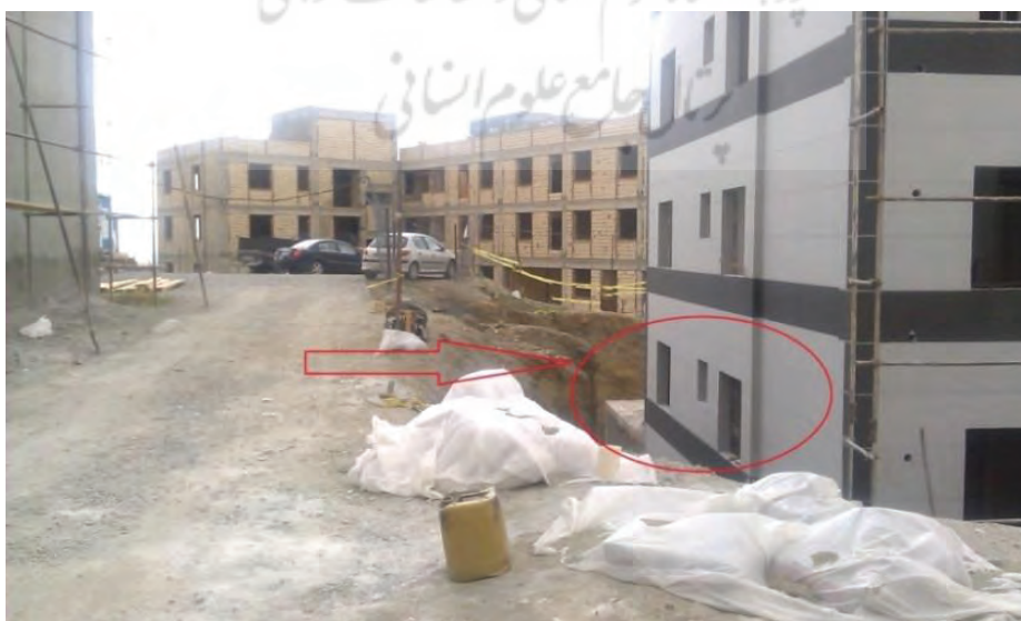
تصویر ۲- ناهماهنگی در اجرا - ارتفاع معبر بالاتر از طبقه دوم محل، سایت تپه امام گل

یافته‌های تحقیق بیانگر آن است که در موارد متعددی فشارهای سیاسی به عنوان یکی از تأثیرگذارترین موانع ایجاد هماهنگی در زمینه تأمین زیرساخت‌های شهری، به ویژه در فاز مکانیابی، برای مناطق جدید مسکونی عمل می‌نماید. به عنوان مثال، نماینده شرکت آب و فاضلاب، در خلال مصاحبه، تأثیر فشارهای سیاسی را بدین شرح بیان نمود: "علی‌رغم اینکه سایت پروژه حاج شمسعلی از منظر تأمین آب برای احداث مسکن نامناسب بود (ارتفاع زمین تقریباً هم‌تراز مخزن آب است و همین موضوع باعث مشکل در تأمین فشار آب می‌گردد)، ولی به دلیل فشارهای سیاسی متأسفانه مکان مذکور انتخاب گردید". تأثیر فشارهای سیاسی تنها به فاز مکانیابی محدود نمی‌شود. در فاز اجرا نیز تأثیرات مخرب فشارهای سیاسی مشهود است. توضیح اینکه در مواردی مقامات سیاسی با اهداف تبلیغاتی، به سازمان‌های زیرساختی فشار می‌آورند که خدمات خود را خارج از برنامه زمانی تعیین شده ارائه دهند و این موضوع باعث عدم هماهنگی در اجرا و بروز مشکلات متعدد اجرایی می‌گردد (تصویرهای شماره ۲ و ۳).