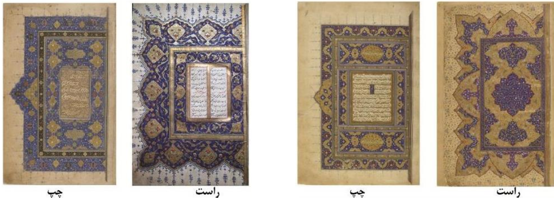
شکل ۴: چپ: طراحی ساختار بخش مرکزی به صورت هندسی در شاهنامه، فرانسه، ۹۵۳ق. (URL9). راست: طراحی ساختار بخش مرکزی به صورت غیرهندسی در شاهنامه، فرانسه، ۹۷۴ق. (URL10).

f2v) که رایت آن را از جمله نسخ تولیدشده در شیراز در دورهٔ آل اینجو، سدهٔ هشتم قمری می‌داند (Wright, 2012: 10). کشمیری نیز استفاده از مثلث‌های تزئینی را در اطراف کادرهای تذهیب‌های دورهٔ صفوی را متأثر از نسخ تولیدشده در دورهٔ پیشاتیموری دانسته است (Kashmiri, 2019: 92). در این تحقیق چنانچه یک لچکی در کنار کادر تذهیب ترسیم شده باشد، لچکی منفرد (شکل ۶، چپ) و اگر لچکی‌ها در سه طرف کادر باشند، لچکی‌های سه‌گانه نامیده شده است (شکل ۶، راست).