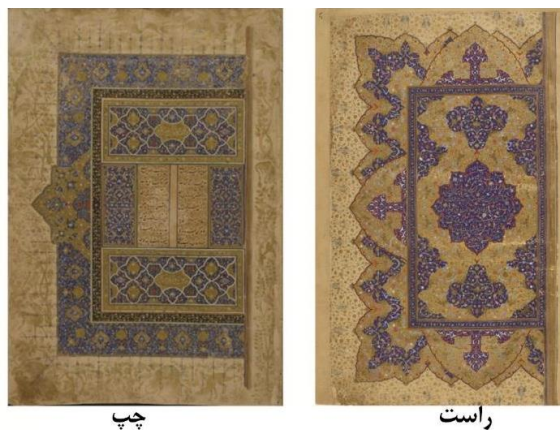
شکل ۶: چپ: کادر ساده به همراه لچکی منفرد در خمسه، بریتانیا، مورخ ۹۴۶ق. (URL13). راست: کادر کنگره‌دار به همراه لچکی سه‌گانه در شاهنامه، فرانسه، مورخ ۹۷۴ق. (URL14)

Fig 5: The use of compounded structures in illuminations. image1: France's Khamsah, dated 944 AH. (URL11). image2: Fitz's Shahnameh, dated 1030 AH. (URL12)