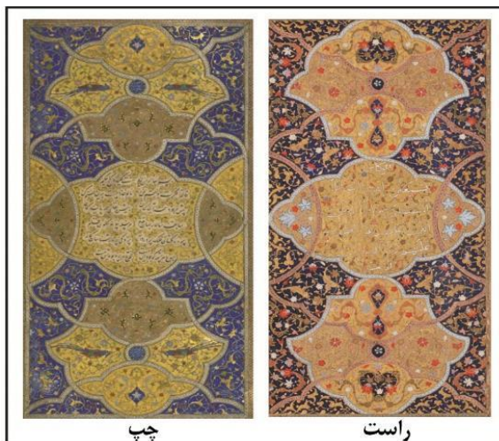
شکل ۹: استفاده از الگوی تذهیب خمسه تولید شده در هند در قرآن تولید شده در ایران احتمالاً شیراز. چپ: خمسه، والترز، مورخ ۹۲۲، محل کتابت هند. (URL20). راست: قرآن، مجموعه خلیلی، مورخ ۹۵۲ق. (URL21)

نکته مهم آنکه در هر چهار نسخه شاهنامه که متنی منظوم در صفحات مزدوج آن‌ها کتابت شده است، مذهب ساختاری هندسی برای کادر بخش مرکزی در نظر گرفته است. قابل توجه آنکه تکرار یک الگو در تذهیب سه نسخه از خمسه‌ها را که دارای ساختار غیرهندسی هستند، شاهد هستیم. چنانچه الگوی خمسه (والترز، نیمه سده دهم) (شکل ۸، چپ) و خمسه (بادلیان، ۹۵۶ق) (شکل ۸، میانی) کاملاً مشابه و الگوی خمسه (اسمیتسونیان، ۹۵۵ق) بسیار شبیه آن‌هاست (شکل ۸، راست). در نقش‌مایه‌های به‌کار رفته در تذهیب‌ها هم شباهت‌های بسیاری دیده می‌شود. برای مثال نقش‌مایه اسلیمی ابری-ماری در هر سه مورد مشابه به‌کار رفته است. ۶ از آنجاکه الگویی بسیار شبیه این پیش از این تاریخ در خمسه ۷۶۰۹W، والترز، ۹۲۲ق، که در هند کتابت شده به‌کار رفته است (شکل ۹، چپ)، می‌توان نتیجه گرفت که این ساختار غیرهندسی الگویی واردتی از هند بوده که با توجه به مبادلات فرهنگی ایران و هند در سده دهم این موضوع کاملاً قابل پذیرش است و جالب اینکه الگوی مورد بحث در قرآن‌هایی به تاریخ ۹۵۲ق در مجموعه خلیلی (شکل ۹، راست) و به تاریخ نیمه سده دهم در موزه ملی هم با کمی تغییرات به‌کار رفته است و شاید بتوان گفت که یکی از مهم‌ترین این تغییرات حذف پرند از تذهیب‌های قرآنی است. ۷ مشکلات کتابت متن منظوم در هر سه خمسه دارای ساختار غیرهندسی به‌خاطر کم‌بودن فضای متنی، از طریق ایجاد فشردگی کلمات، عدم فاصله‌گذاری درست میان دو مصرع و انباشت کلمات در پایان مصرع‌های قابل مشاهده است.