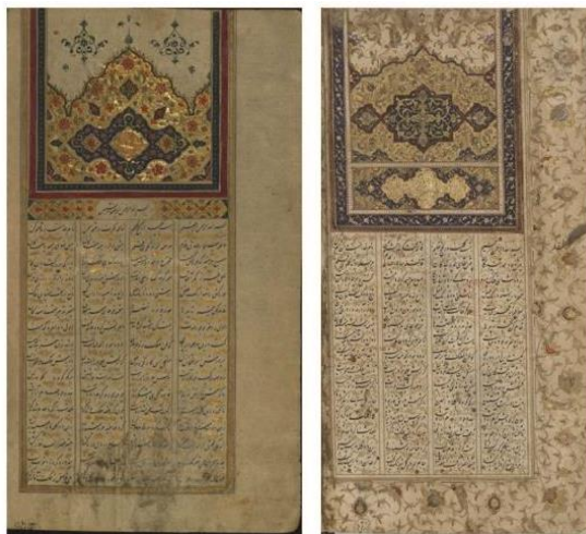
شکل ۷: کاسته شدن از مساحت تذهیب در خمسه‌های سده یازدهم. چپ: ترسیم تنها یک سرلوح در ابتدای متن در خمسه، موزه هنر والترز، مورخ ۱۰۵۹ق. (URL15). راست: ترسیم سرلوح در آغاز متن و تزئیناتی در حاشیه دو صفحه اول و دوم در خمسه کتابخانه ملی فرانسه، مورخ ۱۰۶۰ق. (URL16)

هم‌زمان با کم‌رنگ شدن این نوع از تزئین در خمسه‌ها، شاهد بازگشت مجدد سبکی سنتی و البته بسیار ساده‌تر از صفحات مُذَهَب مزدوج در تذهیب‌های خمسه‌ها هستیم. سبکی که در آن تنها یک سرلوح در بالای بخش آغازین متن ترسیم شده است، خمسه شماره W.611، موزه هنر والترز، ۱۰۵۹ق، (شکل ۷، چپ)؛ خمسه شماره ۱۱۲۰۶۸۹، کتابخانه ملی ایران، ۹۹۰ تا ۱۰۰۸ق؛ خمسه شماره 817864، کتابخانه ملی ایران، سده یازدهم؛ و ده‌ها نمونه دیگر مواردی هستند که تنها یک سرلوح در ابتدای متن آن‌ها ترسیم شده است. علاوه بر این، سبکی جدید هم در این دوره مورد استفاده قرار گرفته است. در این شیوه، مضاف بر سرلوح بالای بخش آغازین متن، حاشیه هر دو صفحه اول و دوم هم مُذَهَب شده است که از جمله آن‌ها می‌توان خمسه شماره Supplement Persan 1111، کتابخانه ملی فرانسه، مورخ ۱۰۶۰ق، (شکل ۷، راست)؛ و خمسه شماره Add MS 6613، کتابخانه بریتانیا، ۱۰۷۶ق را نام برد.