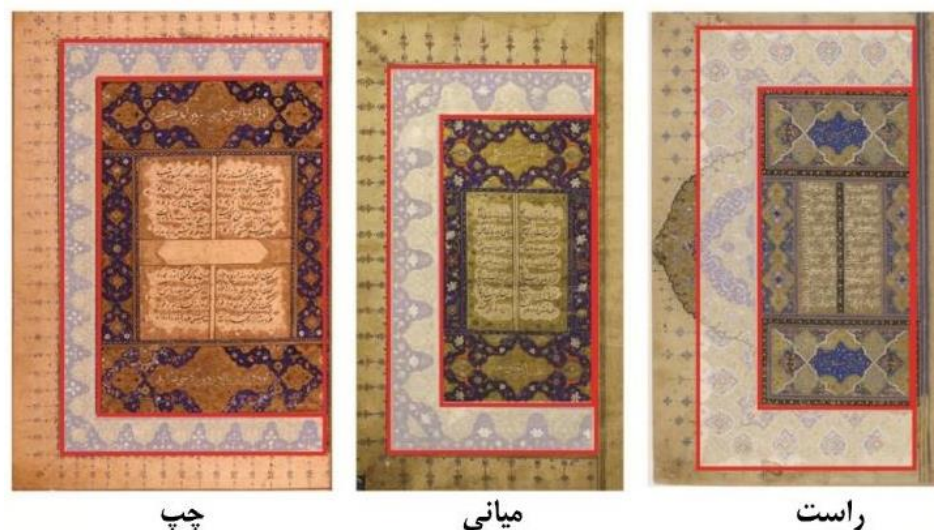
شکل ۳: چپ: کادر کم‌عرض در شاهنامه کتابخانه جان ریلند، مورخ ۹۲۴ق (URL6). میانی: کادر متناسب با نسبت یک سوم در خمسه کتابخانه ملی ایران، مورخ ۹۰۲ق. (URL7). راست: کادر عریض در خمسه فرانسه، مورخ ۹۶۸ق. (URL8)

صفحات مزدوج مذهب دارای دو بخش اصلی هستند، بخش مرکزی تذهیب و کادر تذهیب (حاشیه تذهیب). با توجه به نمونه‌ها، در یک تقسیم‌بندی کلی می‌توان ساختار بخش مرکزی را در قاب‌های تذهیب به سه گروه هندسی، غیرهندسی و تلفیقی (هندسی و غیر هندسی) تقسیم نمود. در ساختارهای هندسی که در آن تقسیمات بخش مرکزی از طریق خطوط متقاطع انجام شده است، دو کتیبه مستطیل‌شکل در بالا و پایین و یک مستطیل در میانه آن‌ها طراحی شده است (شکل ۴، چپ) و در ساختارهای غیرهندسی ترنج یا اشکالی هم‌خانواده با آن در مرکز قاب ترسیم شده و کتیبه‌ها در برخی مواقع حذف و گاهی در قالب اشکالی همچون سرترنج‌ها طراحی شده‌اند (شکل ۴، راست). استفاده از ترنج یا شمشه برای متن بخش مرکزی پیش از صفحات افتتاح، در صفحات عنوان (پشت نسخه) و تقدیمه به کار رفته است. ۵ در میان نمونه‌ها دو نمونه هم‌شناسایی شده است که در دو گروه نام برده‌شده قرار نمی‌گیرند. یکی خمسه (شماره 985 Persan، کتابخانه ملی فرانسه، مورخ ۹۴۴ق) و دیگری شاهنامه (شماره Ms 311، موزه فیتز ویلیام، مورخ ۱۰۳۰ق) در صفحات مذهب مزدوج این دو نسخه می‌بینیم که تقسیمات متقاطع رایج در ساختارهای هندسی اعمال نشده است. هرچند که متن در یک مستطیل مرکزی کتابت شده، ولی لوحه‌های کتیبه‌ای در این دو نمونه ترسیم نشده است (شکل ۵).