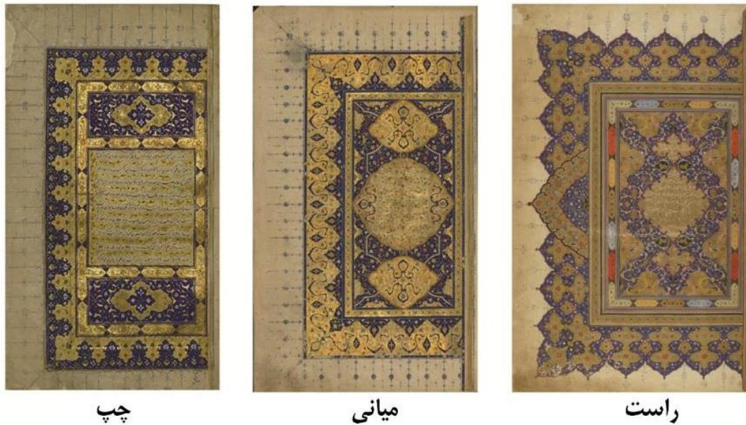
شکل ۱: چپ: ترسیم چهار لوح (دولوحه در هر صفحه) در نسخه شاهنامه دارالکتب قاهره، ۹۰۵ ق (URL1). میانی: حذف کتیبه در نسخه شاهنامه والترز، نیمه سده دهم ق. راست: جانشینی سرترنجها به جای کتیبهها در نسخه شاهنامه، فرانسه ۱۰۱۲ ق (URL3). Fig 1: Image 1: Drawing four panels (two panels per page) in the illumination of Darul- Kitab's Shahnameh, 905 AH (URL1). Image 2: Removing the panels in the illumination of Walter's Shahnameh, half of the 10th century AH (URL2) Image 3: Replacing the another decor instead of the panels in the illumination of France's Shahnameh, 1012 AH (URL)