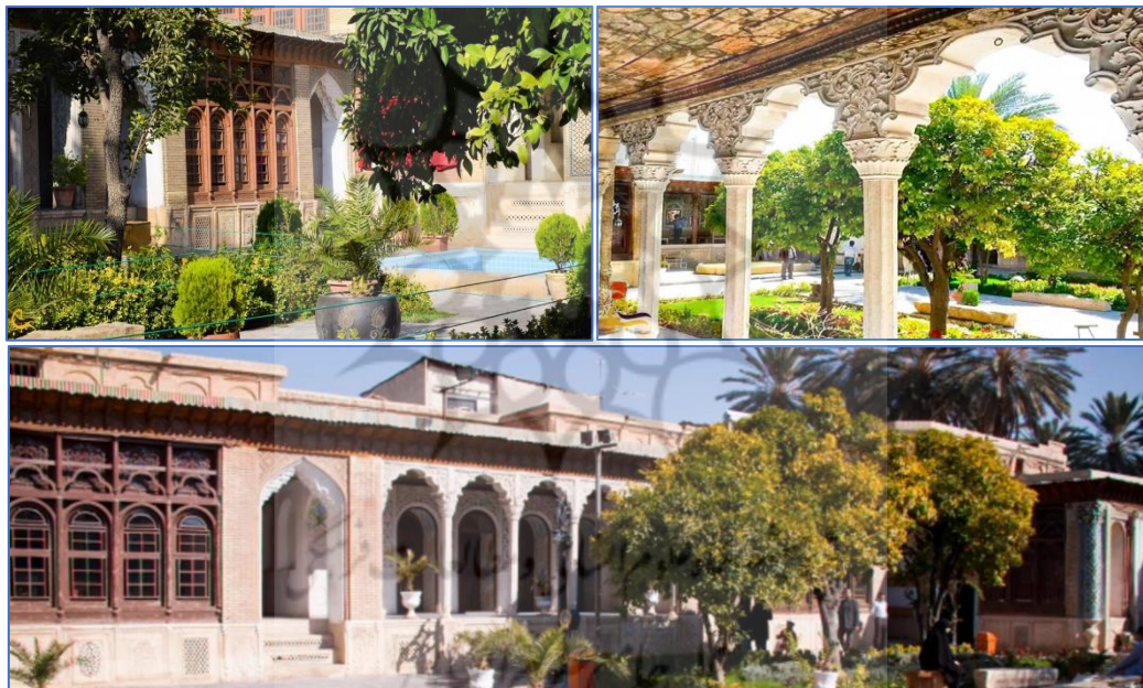
شکل (۲). تصاویر مربوط به خانه زینت‌الملک

زینت‌الملوک مشهور شده است. این بنا از آثار برجای‌مانده از دوره قاجاریه است. ساخت این بنا در حدود سال ۱۲۹۰ هـ ق به‌وسیله علی محمدخان قوام‌الملک دوم (نوه حاج ابراهیم‌خان کلاتر شیرازی) آغاز گردید و در سال ۱۳۰۲ به‌وسیله محمدرضا خان قوام‌الملک سوم به پایان رسیده است. در بدو ورود به خانه قبل از هر چیز توجه ما به سر در زیبای بنا معطوف می‌شود. که در قسمت «پاخوره» حجاری‌هایی از یک سرباز ایستاده بر روی آن به یادگار مانده است. در ورودی نیز از چوب اعلاء ساخته‌شده است و ورودی بنا در قسمت بالای آن دارای مقرنس‌های بسیار زیبا و ظریف آجری است که جلوه و شکوه خاصی به بنا می‌بخشد. پس از گذر از دریاگاه به هشتی وارد می‌شویم، در سمت چپ هشتی دری وجود دارد که به‌وسیله یک راهرو به حیاط خانه مرتبط می‌شود. در روبه‌روی در اصلی نیز دری وجود دارد که به یک اتاق منتهی می‌شود. در پیرامون حیاط و در چهار طرف آن بناهایی وجود دارد که بنا به موقعیت قرارگیری‌شان هرکدام دارای اهمیت و استفاده خاصی بوده‌اند. داخل اتاق‌ها نیز به نحوه جالبی چه در کف چه در دیوارها و چه در آسمانه (سقف) آن دارای وجوه هنری قابل بحثی می‌باشد (شکل ۲).