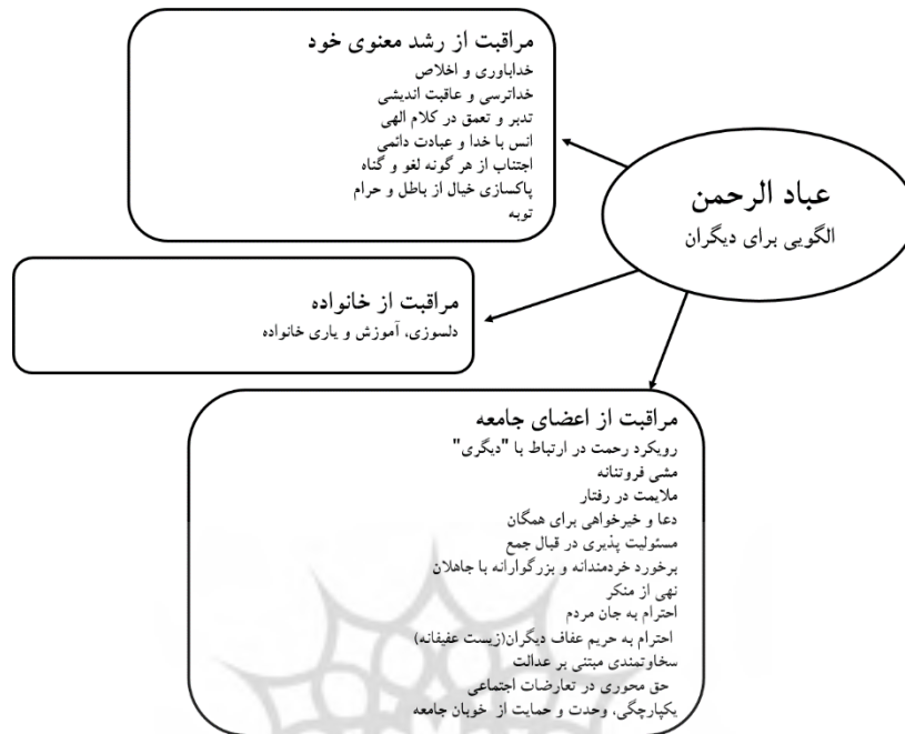
شکل ۳. شاخصه‌های عبادالرحمن

ویژگی‌ها و شاخصه‌های الگوی تربیتی بر اساس آیات ۶۳ تا ۷۵ سوره فرقان در سه محور یاد شده، در شکل ۳ جمع بندی شده است.