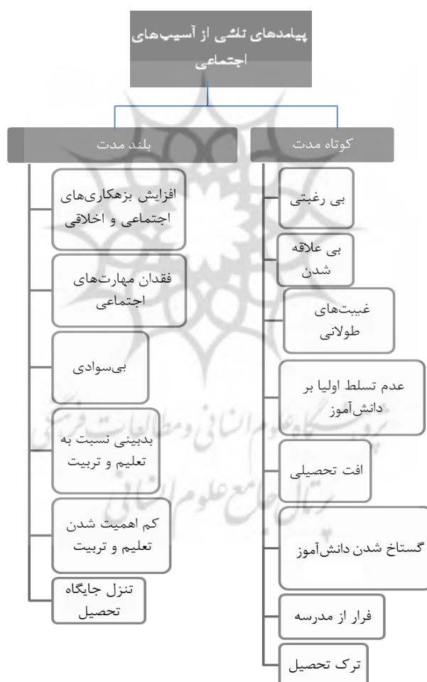
شکل ۲. پیامدهای ناشی از بروز آسیب‌های اجتماعی در حوزه تعلیم و تربیت مناطق مرزی

پرسش دوم: مهم‌ترین مشکلات و تنگناهای ناشی از آسیب‌های اجتماعی در مناطق مرزی در حوزه تعلیم و تربیت از دیدگاه معلمان و مدیران کدام‌اند؟