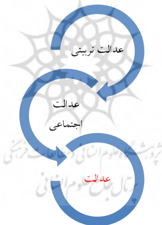
شکل ۴. مقوله‌های استخراجی از متن سند تحول بنیادین آموزش و پرورش مربوط به مؤلفه عدالت